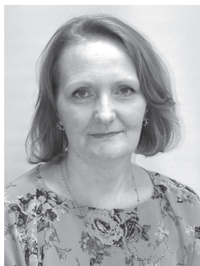
doctorandă, Universitatea Tehnică a Moldovei