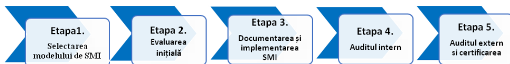
Figura 2. Ciclul de implementare a Sistemului de Management Integrat