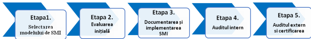
Figura 2. Ciclul de implementare a Sistemului de Management Integrat