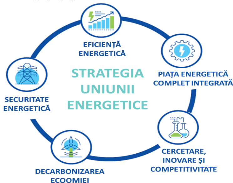
Figura 1. Strategia Uniunii Energetice

În conformitate cu modelarea scenariilor de dezvoltare a sistemului energetic, care este efectuată la elaborarea PNIEC, măsurile planificate trebuie să asigure atingerea obiectivului specific de reducere a emisiilor de gaze cu efect de seră a țării respective, iar cumulativ toate PNIEC ale statelor membre UE trebuie să asigure îndeplinirea obiectivului global al Uniunii Europene în cadrul Acordului de la Paris.