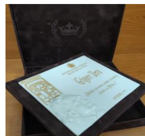
Рисунок 2. Покровный материал