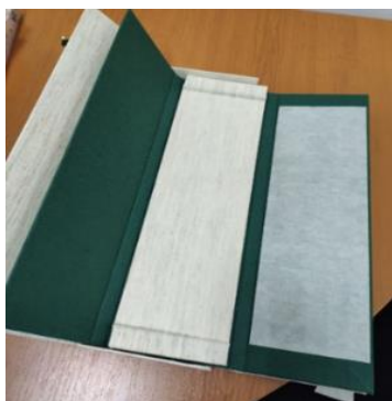
Рисунок 7. Ложемент

Для защитной функции используют усовершенствованные основания . В шуберах это уплотненное дно, которое делается для устойчивости, а в горизонтальных коробах – маленькие ножки, защищающие футляр от трения и продлевающие ему жизнь. Это также хорошая альтернатива ремонту книги, которая в будущем будет защищать ее от износа.