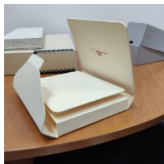
Рисунок 4. Короб

Книжные футляры бывают различных конфигураций и размеров, но в основном их можно разделить на 2 вида (рис. 4 и 5): шуберы и традиционные короба.