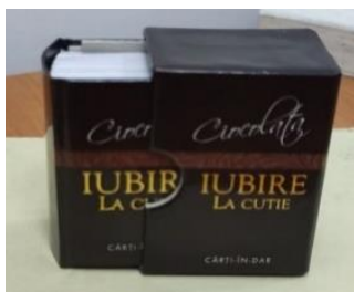
Рисунок 1. Дубликат обложки на футляре

Футляр - это репрезентативная часть книги, отражающая ее содержание и замысел. Дизайн футляра должен соответствовать дизайну самой книги (рис. 1), создавая единое оформление. Однако, здесь можно применить уникальный декор, например, вырубку. Это также хорошая альтернатива ремонту книги, которая и в будущем будет защищать ее от износа. Он изготавливается из различных материалов: от кожи и изысканных тканей (рис. 2) в качестве покровного материала до костей, ручной росписи и фурнитуры, соответствующих внутреннему оформлению книги.