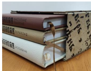
Рисунок 5. Шубер

Традиционный короб (рис. 4, таб. 1). Внешний вид футляров данного образца представлен в виде коробки с крышкой, которая может быть двух видов. В одном случае крышка прикреплена к коробу и откидывается от него, а в другом – отсоединена. Данные футляры нередко оформляют “под шкатулку” и лежат горизонтально.