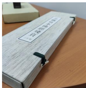
Рисунок 8. Дополнительные крепления

Необходимо заметить, что к транспортировке и хранению футляров также есть особые требования [1]: