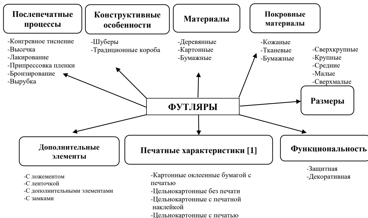
Рисунок 3. Классификация футляров

В рисунке 3 представлены разновидности футляров, исходя из различных их аспектов и особенностей.