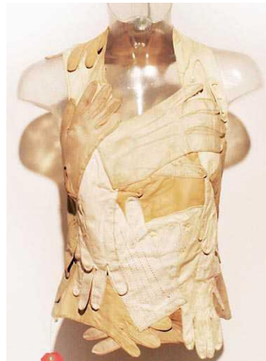
Figura 4. Top realizat din mănuși vintage din satin, primăvară-vară 2001 [3]