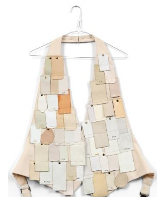
Figura 6. Vestă artizanală pentru bărbați, iarnă 2005-2006 [4]