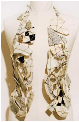
Figura 3. Vestă din fragmente de fărurii sparte, toamnă-iarnă 1989/1990 [3]