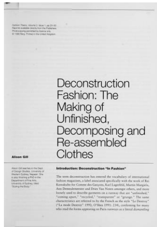
Figura 1. Cartea Fashion Theory: Deconstruction Fashion: The Making of Unfinished, Decomposing and Re-assembled Clothes, Alison Gill, 1998 [1]