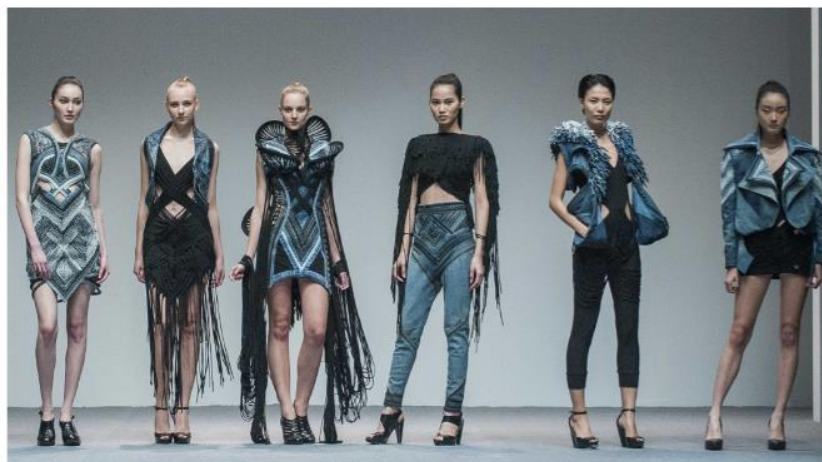
Figura 9. EcoChic Design 2013, Karen Jessen [5]

Designerul german și câștigătorul Premiului EcoChic Design 2013, Karen Jessen a creat această colecție reconstruită prin reconstrucția blugilor second-hand uzați și a tricourilor în surplus de producție [5].