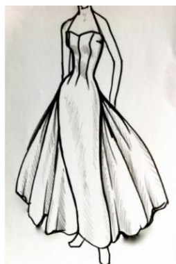
Figura 11. Rochie creată de Gary Harvey [5]