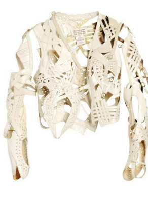
Figura 5. Jeacă din sandale, 2010 [3]