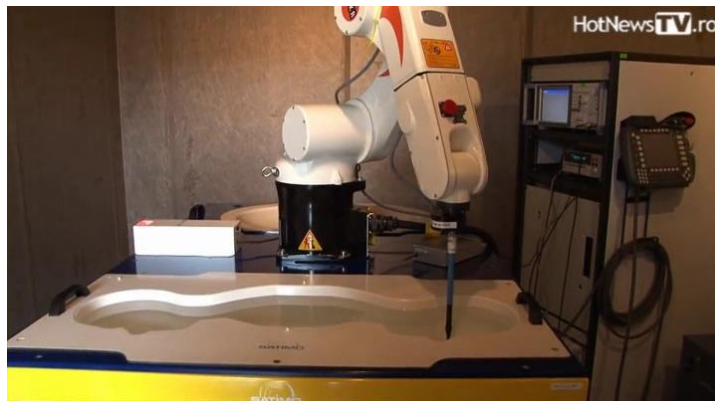
Fig.1 Metodologia măsurării nivelului SAR cu ajutorul utilajului special înzestrat cu sondă, echipament electronic, lichid specific și formă/fantomă

În România există un astfel de laborator în cadrul ICMET Craiova (laboratorul de evaluare și certificare SAR, ICMET, Craiova).