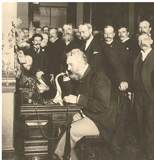
Fig. 2. Prima convorbire telefonică, realizată de către Bell în 1876.