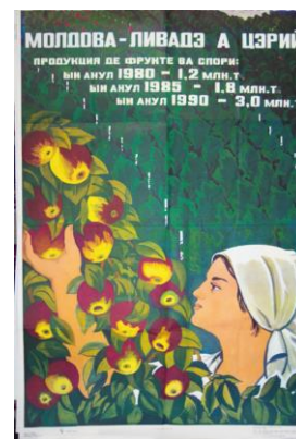
Moldova — livadă a țării! 1979

În afișul „Eroicul anului...” este redată, de fapt, lupta eroică. Coloana din primul plan e stilizată, siluetele contrastează puternic cu ultimul plan. În acest afiș Ion Taburță încearcă un procedeu interpretativ mai adecvat tendințelor sale de a suprapune factura desenului mesajului social-psihologic. În afiș se evidențiază mesajul verbal. Prin reprezentarea brațului ridicat este amplificat sloganul scandat. Mâna dreaptă simbolizează forța, ordinea, autosatisfacția și reprezintă expresivitatea afișului. Prin semiotica gestuală: limbajul corporal, expresia feței, artistul ne transmite starea fiecărui personaj din imagine, exprimarea emoțiilor; transmite atitudinile interpersonale, dominanță/supunere. Expresivitatea afișului este amplificată și de ritmicitatea textului.