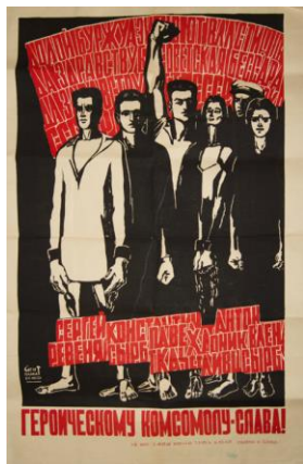
Eroicului comsomol – slavă! 1968

În afișul „Eroicul anului...” este redată, de fapt, lupta eroică. Coloana din primul plan e stilizată, siluetele contrastează puternic cu ultimul plan. În acest afiș Ion Taburță încearcă un procedeu interpretativ mai adecvat tendințelor sale de a suprapune factura desenului mesajului social-psihologic. În afiș se evidențiază mesajul verbal. Prin reprezentarea brațului ridicat este amplificat sloganul scandat. Mâna dreaptă simbolizează forța, ordinea, autosatisfacția și reprezintă expresivitatea afișului. Prin semiotica gestuală: limbajul corporal, expresia feței, artistul ne transmite starea fiecărui personaj din imagine, exprimarea emoțiilor; transmite atitudinile interpersonale, dominanță/supunere. Expresivitatea afișului este amplificată și de ritmicitatea textului.