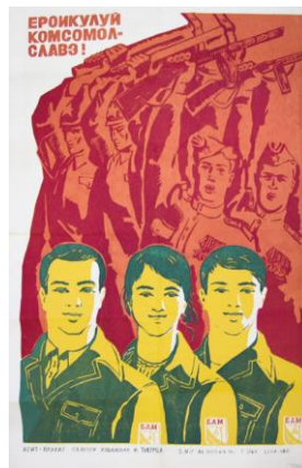
Eroicului comsomol – slavă! 1974

“I. Tăburță a creat, practic, o panoramă ideologică a acestei epoci, reflectând istoricul evenimentelor, idealurile în care credea și spera să fie realizate” (dr. Tudor Stăvilă) [5].