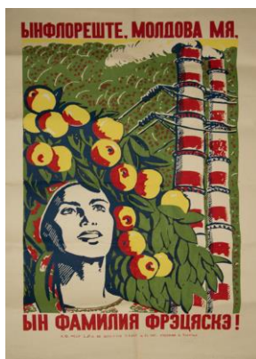
Înflorește, Moldova mea. În familia frățească! 1970