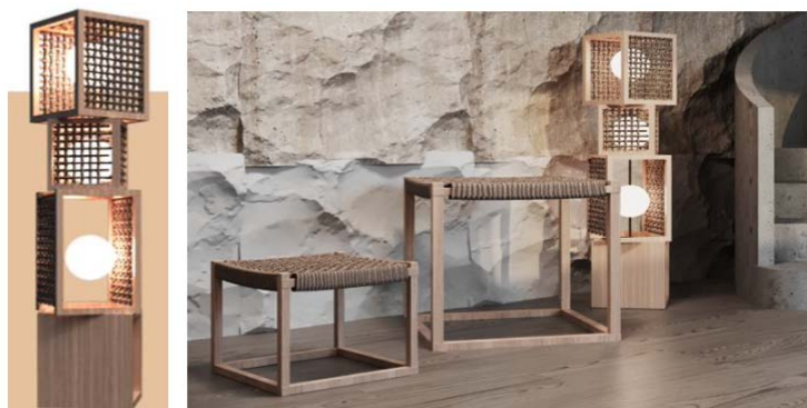
Figura 1. Mobilier realizat din materiale reciclate: lemn, ață de cânepă

Sustenabilitatea este capacitatea de a exista și de a dezvolta fără a epuiza resursele naturale pentru viitor. Dezvoltarea durabilă este o dezvoltare care răspunde nevoilor prezentului fără a compromite capacitatea generațiilor viitoare de a-și satisface propriile nevoi. Presupune că resursele sunt ființe și, prin urmare, ar trebui folosite în mod conservator și atent pentru a se asigura că sunt suficiente pentru generațiile viitoare, fără a scădea calitatea vieții actuale. O societate durabilă trebuie să fie responsabilă social, concentrându-se pe protecția mediului și echilibrul dinamic în sistemele umane și naturale.