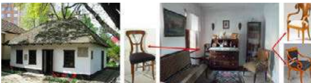
Figura 9. Casa-muzeu Alexandr Pușkin, Chișinău, spațiu interior, interferență stilistică biedermeier, austriacă

Modestia locuinței țărănești reprezintă țesăturile din cânepă, lână, in, lucrate de gospodina casei în zilele de iarnă-lăicere, păretare, prosoape și vestimentația familiei. Dar totuși mobilierul moldovenesc posedă influența stilisticii biedermeier cu linii fine curbate sau drepte, spre exemplu lavița-lada-canapea pentru podoabe are tetieră și cotiere ușor ondulate completate cu elemente de trifoi stilizat, caracteristic stilisticii germane. Obiectele de mobilier din casă devin mai variate: lavița și cufărul-comoda, blidarele și colțarele incrustate sau pictate cu motive vegetative, geometrice, pe poziționează tacâmurii din ceramică sau lemn (fig. 8) (Munteanu A. 2018, 37 p.; Munteanu A. 2018, 32 p.).