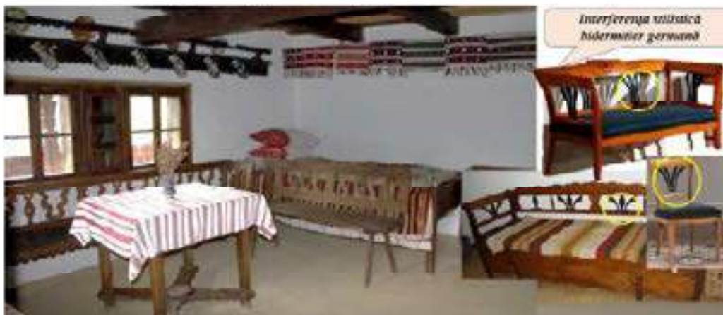
Figura 8. Camera de zi, locuință tradițională cu interferență stilistică biedermeier

Modestia locuinței țărănești reprezintă țesăturile din cânepă, lână, in, lucrate de gospodina casei în zilele de iarnă-lăicere, păretare, prosoape și vestimentația familiei. Dar totuși mobilierul moldovenesc posedă influența stilisticii biedermeier cu linii fine curbate sau drepte, spre exemplu lavița-lada-canapea pentru podoabe are tetieră și cotiere ușor ondulate completate cu elemente de trifoi stilizat, caracteristic stilisticii germane. Obiectele de mobilier din casă devin mai variate: lavița și cufărul-comoda, blidarele și colțarele incrustate sau pictate cu motive vegetative, geometrice, pe poziționează tacâmurii din ceramică sau lemn (fig. 8) (Munteanu A. 2018, 37 p.; Munteanu A. 2018, 32 p.).