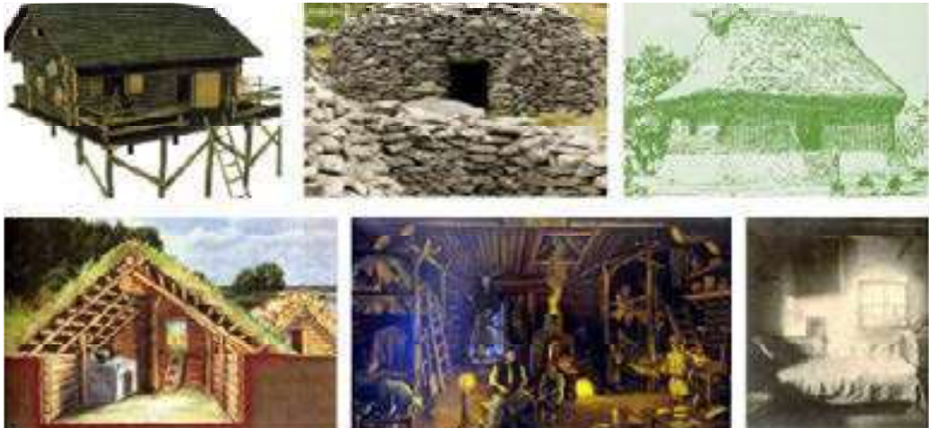
Figura 1. Concept de arhitectura tradițională rustică la diferite popoare

Arhitectura tradițională rustică, indiferent de țară și zona geografică, presupune folosirea materialelor naturale din mediul înconjurător din care se construiesc locuințele – bârne de lemn, piatră, lut, paie atât la interior cât și exterior, bunăoară la popoarele din zona României, Republicii Moldova, Ucrainei s-a folosit lemnul în zonele împădurite și piatra în zonele de munte (fig. 1) (Marcu-Lapadat 2013).