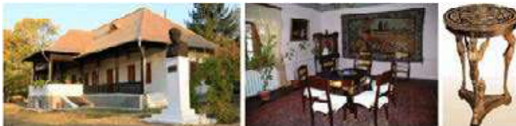
Figura 10. Casa-muzeu Alexandru Donici, casa mare set de mobilier neoclasic empire

specifice secolului al XIX-lea, dar și țesături tradiționale basarabene – scoarțe, lăicere, masa extensibilă cu scaune și o canapea în stilul neoclasic-empire din lemn roșu lăcuit, decorat cu incrustații metalice aurite cu elemente ca: grifoni, cariatide, sfincși, coroane de frunze de laur; bufetul-vitrina, secreter-ul, icoane, sfeșnice din argint și un candelabru, amplasat pe o porțiune din tavanul pictat cu motive florale (fig. 10) (Casa muzeu Al. Donici).