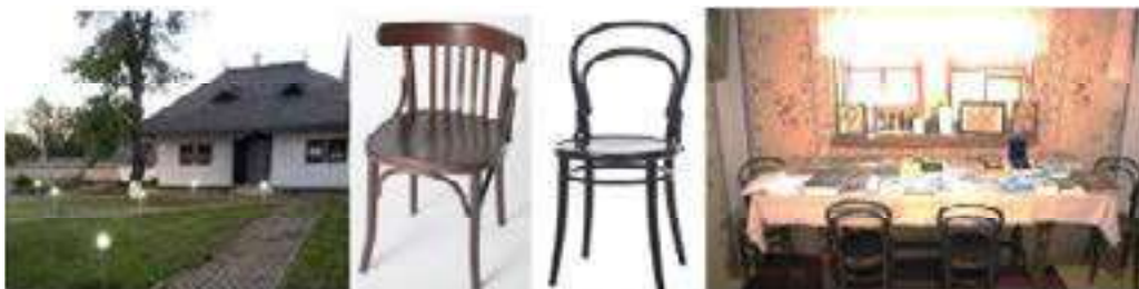
Figura 11. Casa-muzeu “Grigore Vieru”, s. Pererita, scaunul lui Thonet

Un alt exemplu este Casa Muzeu “Grigore Vieru”, satul Pererâta, este un local vizitat de toți iubitorii de limbă maternă și neam, o casă micuță și modestă, unde sa respectat tradiția de interior și exterior al stilisticii arhitectonice naționale, și din nou întâlnim interferența stilistică al mobilierului, scaunul lui Thonet. Un alt muzeu al națiunii este Conacul Lazo din satul Piatra, raionul Orhei, unde la fel observăm multiple influențe stilistice neoclasică, biedermeier la decorul interiorului, pieselor de mobilier, una din variantele scaunului lui Thonet (fig. 11) (Casa muzeu ”G. Vieru”).