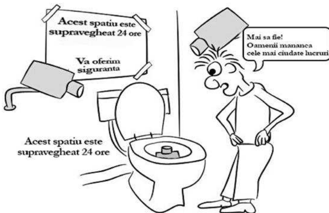
Fig. 2. Probleme legate de confidențialitatea vieții private

a) Confidențialitatea este o problemă. Au existat cazuri în care camerele de securitate au stârnit controverse în cazul instituțiilor, deoarece angajații și-au exprimat nemulțumirea de a fi sub supraveghere constantă fără permisiunea lor și au invocat motivul „încălcarea vieții private”. Criticii susțin că au fost ofensați că sistemele de securitate să fie plasate în birouri și au susținut că acest lucru înseamnă că angajatorul insinuează sau este deja convins că angajații nu sunt cinstiți și vor face ceva necinstit, motiv pentru care activitățile lor să fie înregistrate.