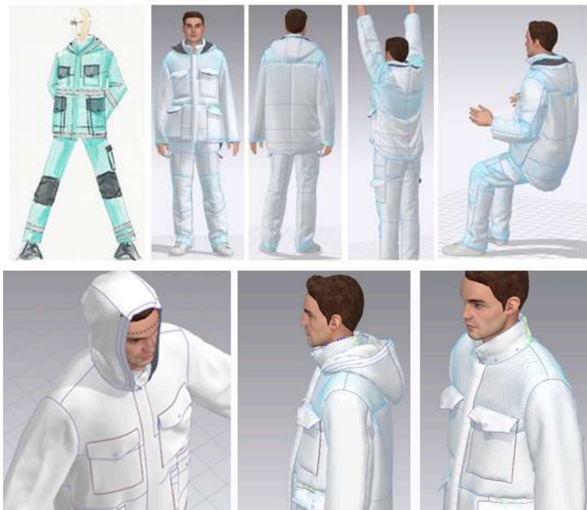
Figura 2. Simularea produsului proiectat în software-ul CLO3D

În eșantionul de îmbrăcăminte rezultat (Fig. 2), se observă zonele de uzură topografică albastre, rezultă că cerințele ergonomice sunt îndeplinite. În dinamică, produsul permite purtătorului mișcări libere, ridicarea brațelor, ghemuit, îndoit picioare în articulațiile genunchiului și șoldului, care permit deplasarea produsului de-a lungul corpului purtătorului.