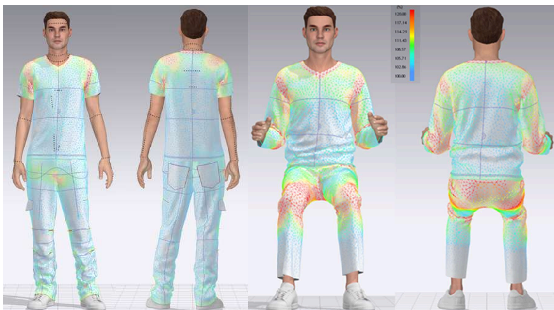
Figura 1. Schemele topografice a îmbrăcămintei în poziție statică și șezut mașinist terasamente

În scopul elaborării îmbrăcămintei funcționale și ergonomice au fost luate în considerare valorile creșterii dinamice a caracteristicilor dimensionale ale corpului bărbătesc. Pentru efectuarea anumitor mișcări, detectarea modificărilor semnificative ale indicatorilor antropometrici individuali ale unei persoane a fost folosit modelul virtual al programului software CLO3D. În figura 1 modelul virtual este în poziția statică și șezut, mișcări efectuate de muncitorii care activează ca mașiniști terasamente, se observă zonele roșii care reprezintă tensiuni esențiale în zona genunchilor, coatelor și feselor.