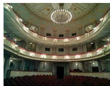
Figura 3. Sala Teatrului Național „Mihai Eminescu”

Sala teatrului, aflată la mijlocul clădirii, are o configurare circulară, înconjurată din trei părți de balcoane, cu foaiere și culoare, încununate cu o cupolă sferică. Lojele și balcoanele repetă configurația sălii, fiind dispuse perimetral, cu acces prin scări monumentale cu trei rampe. (Fig.3) În cadrul studiului s-a constatat că construcția se afla într-o stare satisfăcătoare, cu anumite deteriorări care necesită reparație parțială și renovare estetică.