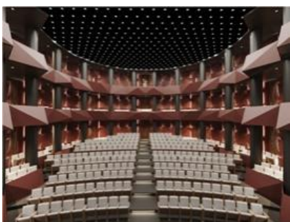
Figura 4. Proiect Sala mare a teatrului

Materialele utilizate în spațiul sălii de teatru sunt selectate conform normativelor și tendințelor actuale în domeniul dat, folosindu-se texturi polimerice combinate cele naturale. Soluțiile de prelucrare a tavanului și pardoselei sunt optime prin ofertele sale de rezistență în timp, condiționare, acustică, izolare fonică, termică, practicitate și eficiență la întreținere. Mobilierul este adaptat funcțional și ergonomic la confortul și comoditatea spectatorului, asigurând vizibilitatea scenei prin amplasarea în trepte. Soluția cromatică ne propune o nuanțare monocromă, de la nuanța marsului roșietic deschis la bejul-cenușiu deschis, trecând prin nuanțe calde de ocru roșu înviorate cu tonuri pastelate de smarald. Paleta coloristică este destul de intensă, concentrată și succulentă, fapt care oferă crearea unui anturaj sobru, fastuos, somptuos, elegant și impresionat (Fig. 4,5,6).