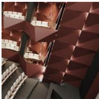
Figura 5. Scena teatrului