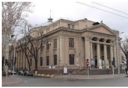
Figura 2. Teatrului Național „Mihai Eminescu”