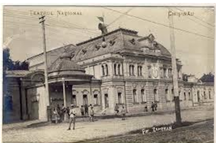
Figura 1. Clădirea teatrului din 1920

După o succintă incursiune istorică cunoaștem că clădirea teatrului datează din anul 1920 fiind primul teatru de expresie română în Basarabia, înființat din inițiativa unui grup de fruntași ai vieții publice locale de epocă (Fig. 1). Numele lui Mihai Eminescu îi este atribuit în anul 1988, iar în anul 1994, este oficializat ca Teatru Național [1]. Construită pe un subsol clădirea este ridicată în trei niveluri, dintre care ultimul este un atic, iar întreaga planimetrie ocupă colțul unui cartier, rezervat cândva pentru piața polițienească mărginită lateral cu strada Mihai Eminescu. Aspectul arhitectonic al clădirii este monumental, grație amplasării retrase de la linia bulevardului și poziția ridicată a intrării principale pe un podium din trepte (Fig. 2).