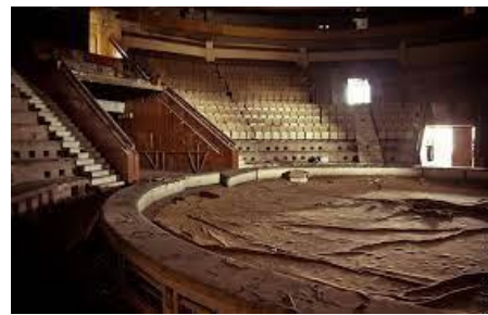
Figura 14. Actuala sală mare a circului

Alegerea temei a fost argumentată prin necesitatea de a readuce faimosul monument arhitectural la o nouă viață, deoarece istoricul multor generații trecute este strâns legată de amintirea minunatelor prezentări de circ, iar imaginea Chișinăului deseori era identificată prin frumosul edificiu. După cum remarcă și presa din țară „prin restabilirea acestui monument istoric se urmărește atât un impact economic pozitiv, cât și un impact social de lungă durată. Scopul general al acestui proiect este de a aduce Cercul din Chișinău la un nivel de importanță națională prin păstrarea valorilor inițiale și prin renovarea ideii conceptuale. Astfel, vom putea obține un ansamblu de beneficii cum ar fi creșterea turismului, mărirea bugetului instituției, restabilirea locurilor de muncă, precum și de a oferi publicului, mai ales copiilor, momente de bucurie, pentru că circul reprezintă întruchiparea zâmbetelor și a emoțiilor pozitive” [8, p. 62].