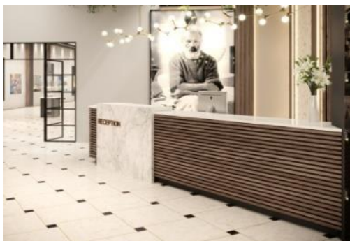
Figura 10. Zona recepției

Idea generală a proiectului este ca designul interior al acestui edificiu să capteze și să ghideze delicat atenția vizitatorilor spre valoarea operelor de artă, creându-le condiția optimă de delectare și savoare a acestora într-o ambianță meditativă, filosofică și ușor onirică. Conceptul principal al numelui edificiului este subliniat în zona recepției (Fig. 10), care produce prima impresie și implică vizitatorii în contextul simbolic al artei naționale prin imaginea și opera lui C. Brâncuși. (Fig.10)