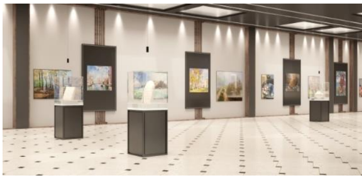
Figura 11. Sala de expoziții

Însăși mobilierul recepției este proiectat din lemn natural combinat cu mici bucăți de marmură pentru a crea o impresie caldă primitoare și ușor rustică ce ar predispute vizitatorii la o ambianță familiară apropiată de spiritul național. Totodată ideea naționalului rămâne doar la nivel sensibil sugerată prin calitatea materialelor, deoarece formele plastice: recepția, ușile, stativele, panourile, corpurile de iluminat etc. din cadrul interiorului sunt tratate într-un limbaj modern, de o factură foarte ușoară în culori deschise și vibrante (Fig. 11).