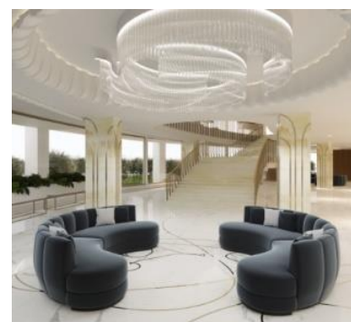
Figura 17. Hol, trecere spre cafenea Cercului