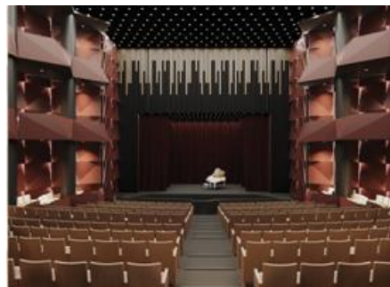
Figura 6. Forme plastice în sala teatrului