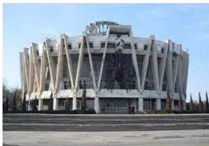
Figura 12. Cercul de Stat din Chișinău