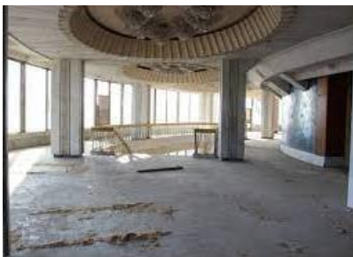
Figura 13. Holul actual al Cercului