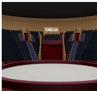
Figura 16. Sala mare a Cercului