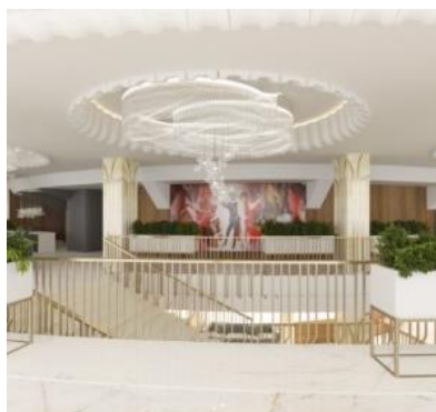
Figura 15. Holul Cercului

Edificiul fiind inițial dotat cu tot necesarul tehnico-ingineresc corespunzător pentru timpurile trecute, însă astăzi acestea sunt depășite și deja ineficiente, fapt care a motivat cercetarea și implementarea noilor performanțe în domeniu. În acest sens au fost selectate cu minuțiozitate aparatele și tehnica necesară de aierisire, condiționare, încălzire, menținere a umidității, instalații și echipamente adaptate spectacolelor de circ: lumină, montare hardware, decoratiuni, draperii, sfoare, șine etc. - toate acestea conectate la noile posibilități ale actorilor în jonglerie, acrobație, echilibristică, iluzionism, clownerie etc. [9]. Un alt aspect important este că circul trebuie să fie dotat cu spații foarte bune pentru întreținere animalelor și crearea condițiilor de dresare și repetiții cu acestea. Astfel, în cadrul acestui proiect a fost necesară consultarea mai multor specialiști pe diverse domenii adiacente circului.