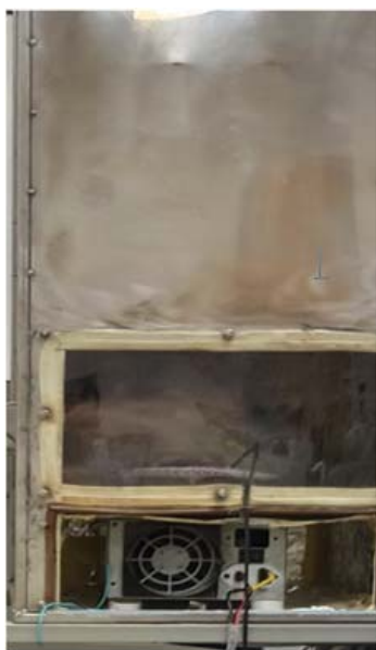
Figura 1. Sistemul experimental elaborat pentru cercetarea procesului de deshidratare a produselor agricole (Foto)

Standul de laborator permite cercetarea procesului de deshidratare a diferitor produse agricole, atât prin metoda clasică, cât și prin metoda propusă de autori – cu aplicarea tratării în strat suspendat.