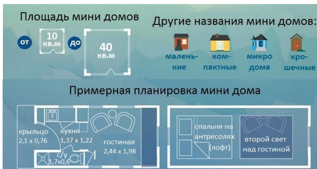
Рисунок 1 - Основные характеристики типичных мини домов [1]

Плюсы дома-игрушки [4-6] очевидны, это: минималистичность (нет места для ненужных вещей), экономичность (доступная цена для возведения, содержания и обслуживания сооружения), мобильность (некоторые модели могут быть возведены на колеса), практичность (легко и быстро в возведении), компактность (не нуждается в большом участке земли), экологичность (небольшие размеры сооружения позволяют использовать в строительстве натуральные материалы), легкость в энергообслуживании (затраты электроэнергии настолько малы, что солнечные панели могут полностью покрыть необходимость данного ресурса).