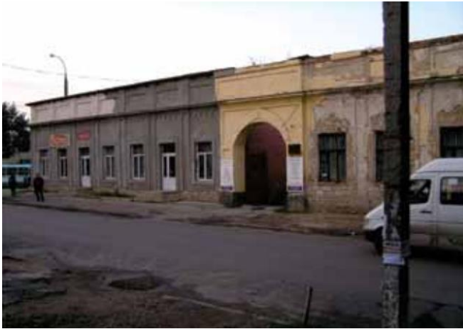
Figura 2. Curtea Mănăstirii Dobrușa [1]