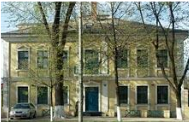
Figura 4. Ambasada Ungariei [2]

La Chișinău acest proces este în plină desfășurare. Exemple de clădiri restaurate calitativ, cum ar fi vila care găzduiește Ambasada Ungariei, sunt rare. Clădiri reprezentând mărturii de valoare din perioada țaristă, cum ar fi luxoasa Vila Herța (construită în anii 1902-1903), continuă să se ruineze [2].