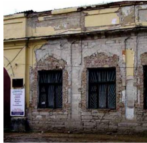
Figura 3. Detaliile Mănăstirii [1]