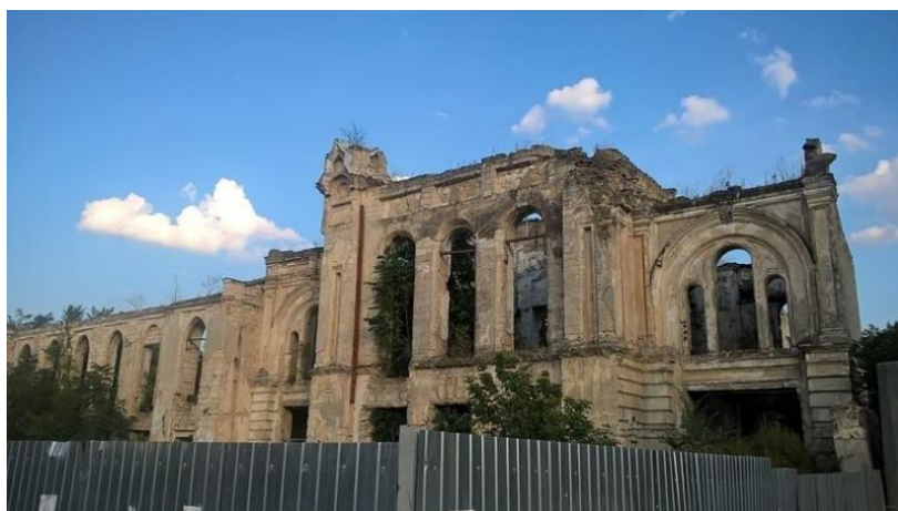
Figura 6. Ruina Sinagogii și a Azilului pentru Bătrâni [2]