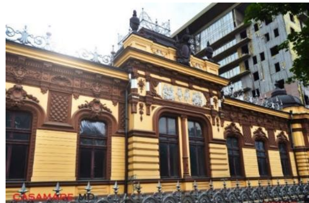
Figura 5. Vila Herța, clădire moderna nefinisată [2]