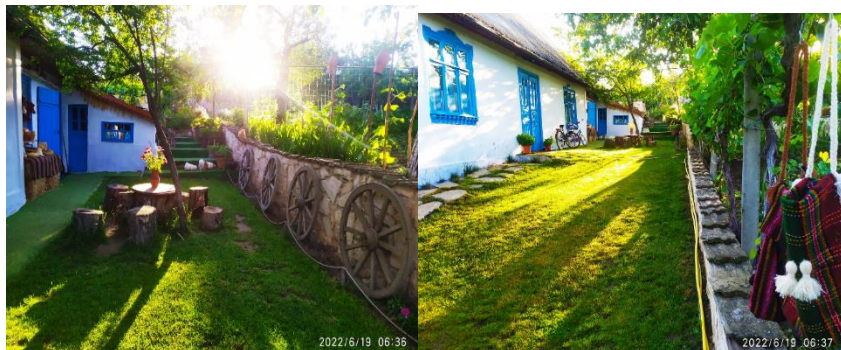
Figura 1: Muzeul Țăranului din Molovata Nouă

valoare toate elementele patrimoniului cultural imaterial, au fost valorificate bogățiile cadrului natural: piatra, lemnul, lutul, cornul, fibrele vegetale (câneapă, inul, lozia, paiele, stuful, papura, nuiielele), care sunt activități străvechi, practicate și azi pentru a crea obiecte de prima necesitate. Astfel, meșteșugurile populare continuă să contureze specificul localităților. Pietrari din Cosăuți, Soroca, din neam în neam au dat expresie monumentală localității, satelor din jurul Sorociei, dar și celor aflate la o mai mare depărtare precum Mașcăuți, Orheiul Vechi care și-au dorit lucrări cu rezistență artistică, salvată în piatră. În satul Cosăuți s-au format un șir de meșteșugari – pietrari vestiți: A. Ciumac, U. Lozan, I. Gîțlan, S. Belous, I. Sapojnic, V. Știrbu, dar și familii întregi Hămuraru, Zagaevschi, Zolotariov ș. a., care au pregătit o serie întregă de tineri-ucenici în acest domeniu [4].