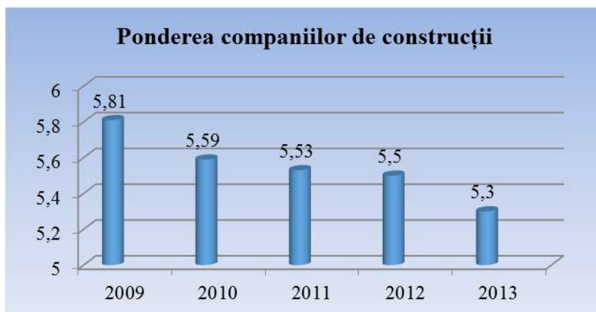
Figura 1. Ponderea companiilor de construcții față de totalul întreprinderilor din Republica Moldova

Având în vedere că acest sector are o importanță deosebită în asigurarea creșterii economice durabile a Republicii Moldova, este necesară susținerea lui prin crearea de condiții juridice și economice stabile, necesare dezvoltării activității de întreprinzător.