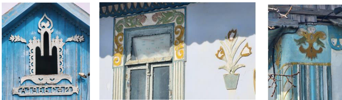
Figura 4. Reprezentarea simbolurilor vegetale pe casele tradiționale din s. Gradiște

Simbolurile vegetale erau reprezentate de crenguța de brad , de pomul de brad , arbori , glastre cu flori sau ghivece , spice de grâu sau secară , frunze (fig. 4), toate fiind asociate cu arborele vieții, simbol biblic al lui Hristos și al nemuririi [5]. Arborele vieții era considerat un simbol al vitalității și fertilității, un model pentru toate plantele miraculoase care vindecă bolile și restabilesc tinerețea, acesta fiind întâlnit în mitologiile multor culturi [1].