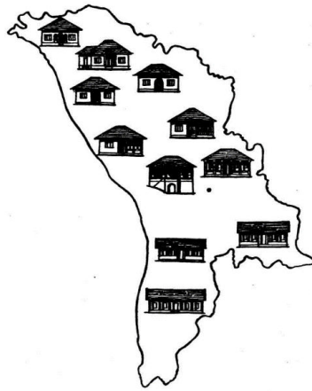
Figura 1. Harta distribuției tipurilor de case tradiționale pe teritoriul RSSM [3]