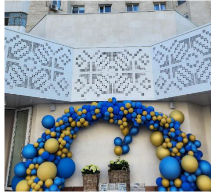
Figura 12. Restaurant La Plăcinte, Mun. Chișinău.