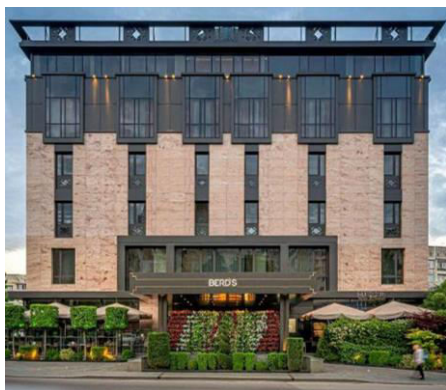
Figura 10. Hotel Berd's, Mun. Chișinău [7]

Astăzi imaginile simbolice nu mai sunt înțelese ca atare, datorită procesului de desacralizare și desemantizare survenit în decursul timpului [2]. Arhitecturii revine un rol important în păstrarea elementelor decorative ce reprezintă o valoare culturală și o parte a patrimoniului țării. Toate simbolurile menționate mai sus, nu pot fi integrate pe deplin în stilistica arhitecturală contemporană, dar introducerea acestora sub o formă potrivită funcționalității, ar duce la păstrarea tradițiilor și a identității culturale. Printre simbolurile predominante în arhitectura contemporană, pot fi regăsite adesea cele vegetale și geometrice, acestea obținând un nou aspect și mesaj fiind realizate din diferite materiale. Utilizarea acestora oferă locației o unicitate aparte și ajută la păstrarea tezaurului decorativ-folcloric național. Un exemplu reușit de introducere a simbolurilor geometrice sunt clădirile existente din cadrul or. Chișinău, care au integrat armonios elementele naționale cu stilistica contemporană, primul fiind Hotelul Berd's, amplasat în preajma centrului comercial Atrium, Biroul de arhitectură situat pe str. București și noul restaurant la Plăcinte, ce au introdus o mulțime de elemente specifice culturii moldovenești atât în exterior cât și în interior.