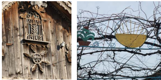
Figura 8. Reprezentarea soarelui.

Un alt element arhitectural regăsit pe frontoane face parte din categoria simbolurilor cosmogonice, și anume, simbolul soarelui ce avea menirea de a curăța spațiul de orice influență malefică. Ca și alte simboluri cu rol de protecție, acesta apare frecvent la porți, și nu întâmplător: poarta, după cum s-a menționat anterior, era considerată un prag de trecere între lumea exterioară (de unde, conform credințelor, puteau veni toate relele) și cea interioară, care trebuia păzită [5]. Soarele a devenit o emblemă a binelui și o sursă puternică de rodire prin căldură și lumină [2].