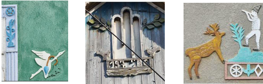
Figura 7. Reprezentarea păsărilor și a cerbului pe frontoanele și fațadele caselor.

Un alt element arhitectural regăsit pe frontoane face parte din categoria simbolurilor cosmogonice, și anume, simbolul soarelui ce avea menirea de a curăța spațiul de orice influență malefică. Ca și alte simboluri cu rol de protecție, acesta apare frecvent la porți, și nu întâmplător: poarta, după cum s-a menționat anterior, era considerată un prag de trecere între lumea exterioară (de unde, conform credințelor, puteau veni toate relele) și cea interioară, care trebuia păzită [5]. Soarele a devenit o emblemă a binelui și o sursă puternică de rodire prin căldură și lumină [2].