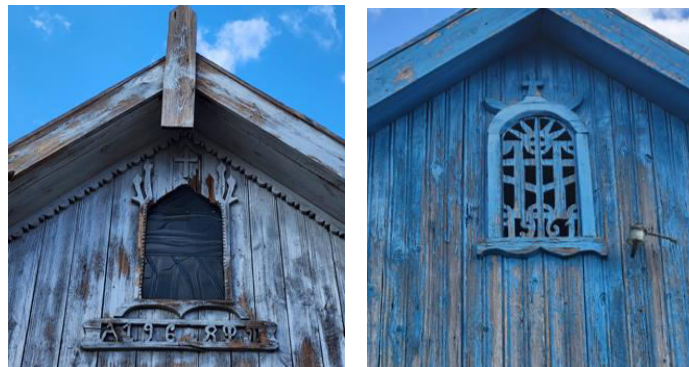
Figura 9. Reprezentarea crucii pe frontoane. Poze realizate de autor.

Datorită sufletului credincios al țăranului, pe case deseori era reprezentată crucea , un simbol al creștinismului, ce relatează moartea și învierea lui Hristos, dând speranța vieții veșnice pentru toți creștinii și care avea rolul de ocrotire a casei de toate cele rele [5]. Crucea a fost și rămâne unul dintre cele mai des și puternice simboluri utilizate de către om, care poate fi regăsită și în spațiile publice.