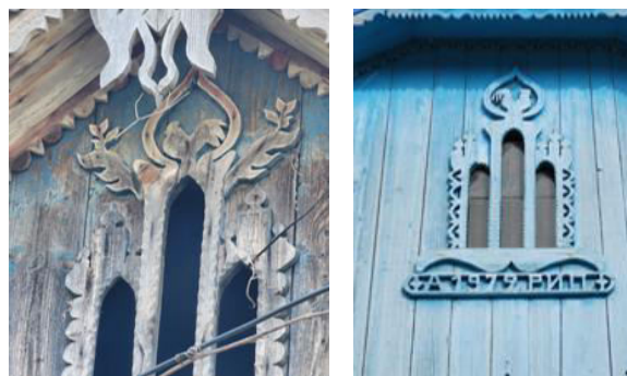
Figura 6. Reprezentarea cocoșului pe frontoanele caselor.