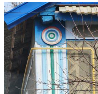
Figura 3. Reprezentarea simbolurilor geometrice pe casele tradiționale din s. Gradiște