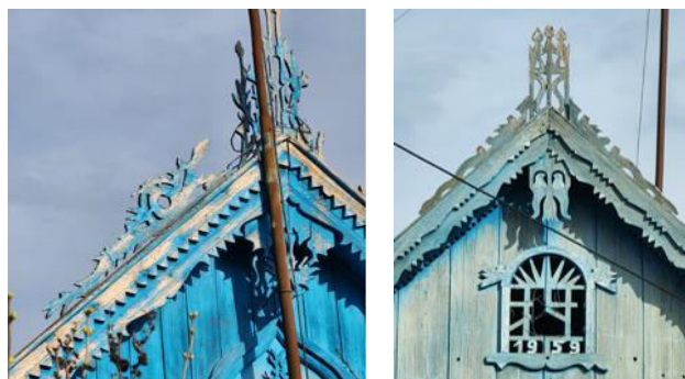
Figura 5. Reprezentarea șarpelui sub formă de balaur.

Cele mai vechi și mai des întâlnite reprezentări simbolice erau cele legate de animale și păsări. Deseori pe coama acoperișului erau ilustrați balaurii, care, de fapt erau aceiași șerpi (fig. 5). Cu siguranță, mulți ar asocia șarpele cu un personaj negative, datorită rolului său descris în biblie, dar în experiența străveche a țăranului, venită din perioada neolitică, când șarpele era un simbol al ocrotirii produselor agricole împotriva rozătoarelor, era prietenul omului. Se spunea că dacă la casa era șarpe („șarpele de casă”), atunci nici un farmec nu se apropie și totul mergea bine [7].