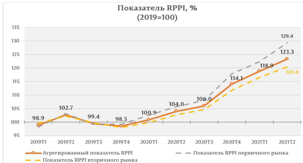
Рисунок 2: Индекс цен на жилую недвижимость [2]

Только по состоянию за конец второго квартала 2021, цена предложения на жилую недвижимость в мун. Chişinău продолжила тенденцию к росту, начиная с первого квартала 2020. Показатель RPPI за отчётный период составил 123,3 процента, будучи больше на 8,1 процента по сравнению с четвёртым кварталом 2020 и на 18,6 процентов по сравнению со вторым кварталом 2020 [2].