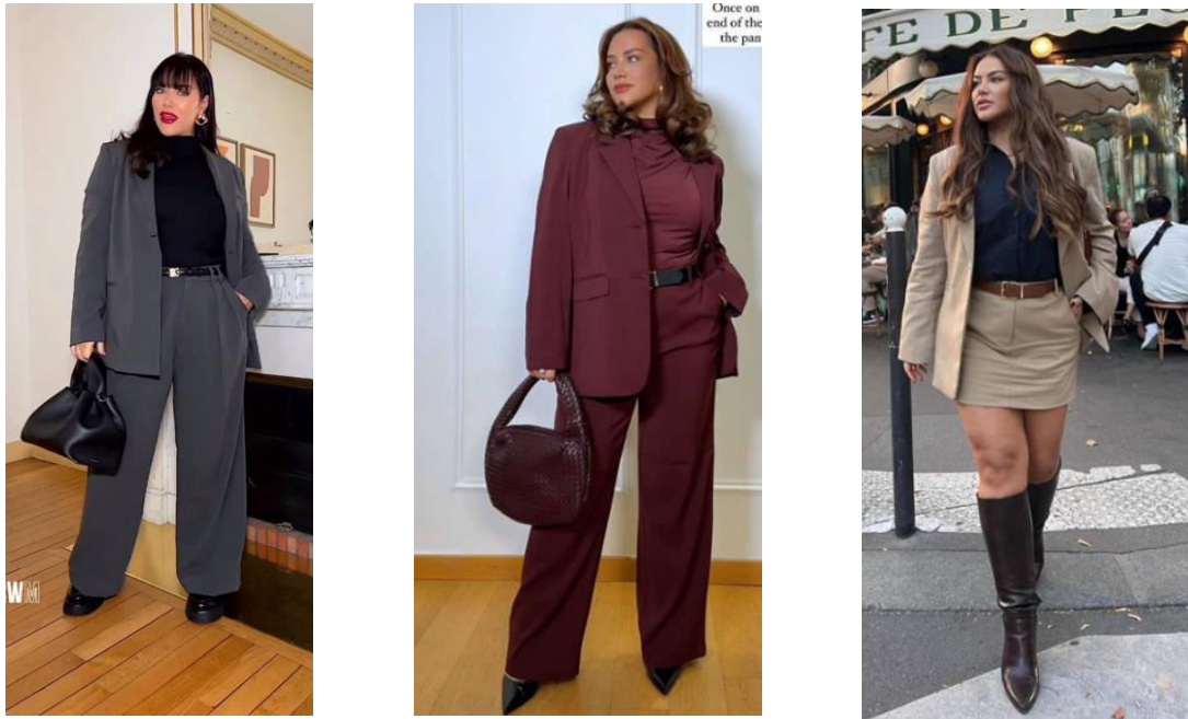
Рисунок 4. Варианты использования различных цвета в публикациях популярных блогеров (@militzayovanka) сети Instagram в сегменте моделей плюс-сайз