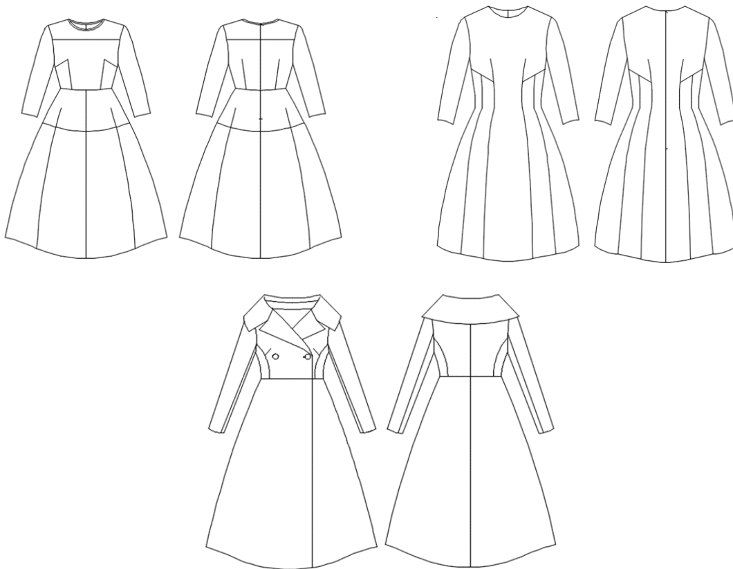
Рисунок 5. Эскизы моделей женских платьев, предложенные в рамках проекта

Анализ приемов и средств гармонизации формы, а также техника применения декоративных элементов позволили, разработать следующие модели женских платьев.