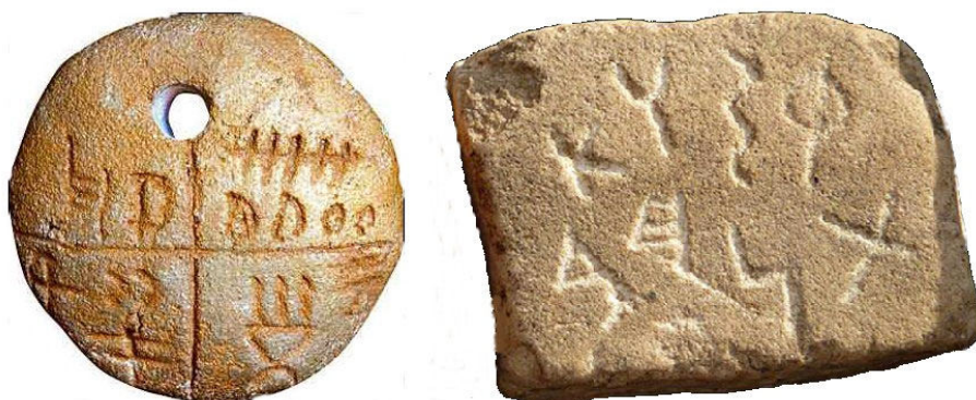
Fig. 1. Un medalion de la Tărtăria (stânga) și o tăbliță de la Hândrești (dreapta).

Zona Carpato-Danubiană și Balcanică a Europei se caracterizează prin utilizarea a trei sisteme de scriere: scrierea danubiană, scrierea alfabetică de uz current, și scrierea sacră. La cele trei sisteme de scriere se mai adaugă și modul de notare a textelor care se cântă, foarte asemănător scrierelor psaltice. Sub denumirea de Scriere Danubiană (Danube Script sau Scrierea Dunăreană) se înțelege un tip de scriere bazat pe ideograme care a fost răspândit în zona Dunării dar și în zone mai îndepărtate cum ar fi Orientul Apropiat și în Franța. Acest tip de scriere este considerat cel mai vechi din lume și au fost găsite artefacte la Turdaș, Tărtăria, Hândrești-Oțeleni, Vadul Rău, Vinča (Serbia), Glozel (Franța). Exemple de scriere danubiană sunt prezentate în figurile 1 și 2.