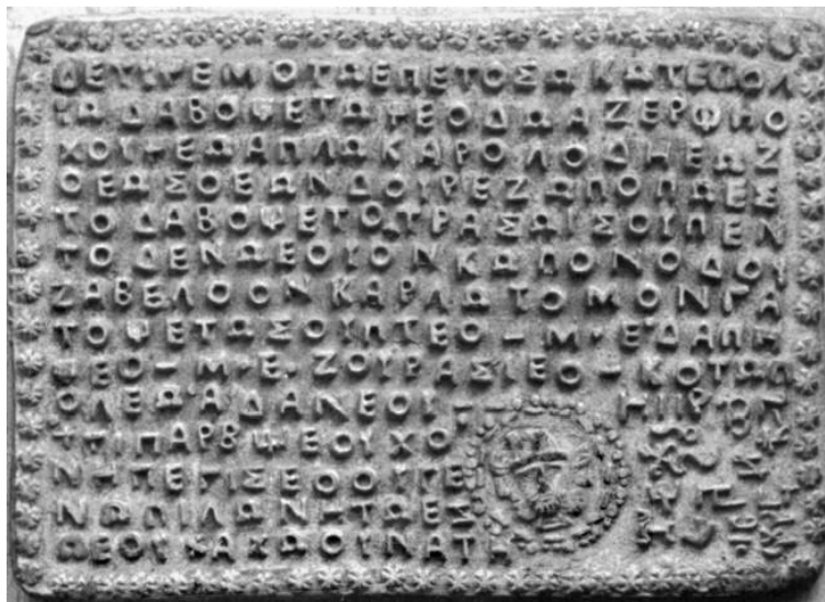
Fig. 9. Plăcuța 35. Despre plimbarea Zeului Suprem prin țara geților.

Majoritatea tăblițelor conțin o scriere alfabetică completată, uneori, cu ideograme. O astfel de tăbliță este și cea cu numărul 35 din cartea lui Romalo referitoare la locurile sfinte ale geților și dacilor realizată cam pe la sfârșitul domniei lui Decebal de către marele preot Petoso, și prezentată în figura 9.