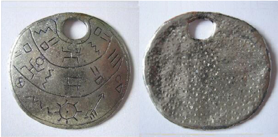
Fig. 2. Medalion metalic din zona Bacău.