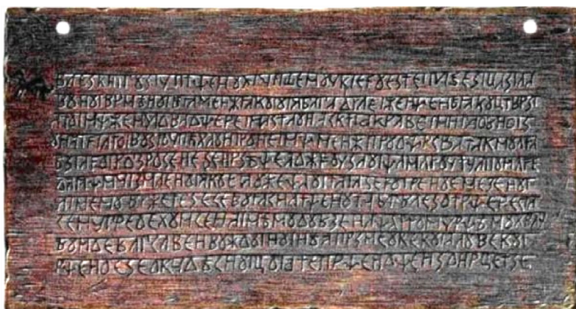
Fig. 11. Plăcuță de lemn din “Cartea lui Veles sau Volos”.

Concluzii: In zona carpato-danubiana și balcanică a Europei au fost utilizate trei sisteme de scriere: o scriere ideografică cunoscută drept scriere danubiană, o scriere alfabetică din care provin alfabetele moderne, și o scriere sacră folosită mai ales de către Deceneu. O situație aparte o prezintă tăblița 90 care conține o scriere ideografică completată cu notații muzicale care se regăsesc și astăzi în scrierile psaltice utilizate în serviciile religioase. Majoritatea tăblițelor de la Sinaia conțin o scriere alfabetică completată, uneori, cu ideograme ale scrierii danubiene.