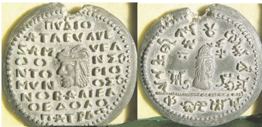
Fig. 7. Vederi de pe cele două fețe ale medalionului de la mănăstirea Sinaia.