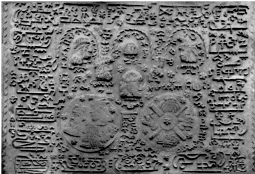
Fig. 4. Plăcuța 90 cu scriere ideografică și notații musicale.

Plăcuța 90 (figura 4) conține scriere ideografică completată și cu notații musicale. Ea conține atât ideograma sub forma liniei în zigzag, cu șase laturi, ca și cea de pe medalion, ideograma formată din trei linii orizontale “≡”, ideograma corespunzătoare unui pătrat sau dreptunghi dar și alte ideograme cum sunt triunghiul cu vârful în sus, sau cu vârful în jos. Plăcuța 90 mai conține și imagini ale unor personaje despre care se poate aprecia ca au trăit înainte de Burebista.