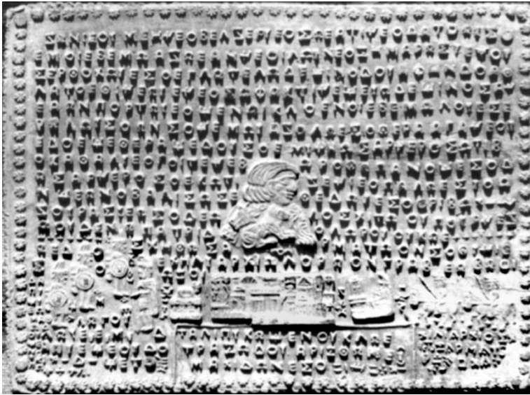
Fig. 10. Täblița 79. Deceneu imprimă noi plăci la Genucla.