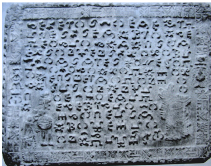
Fig. 8. Tăblița 10, depunerea inimii lui Burebista pe altarul de la Genucla.

În tăblița 10 (fig.8) Deceneu folosește alfabetul sacru pentru a descrie cum regina Mara - soția lui Burebista - a depus inima soțului ei pe altarul de la Genucla, iar capul său a fost dus la Sarmisegetuza. Un alfabet asemănător a fost utilizat tot de Deceneu în tăblița 31 în care se afirmă că Erigeriu i-a construit un monument lui Burebista la Sarmisegetuza.