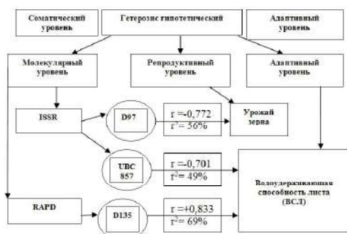
Рис. 1. Существенные корреляционные зависимости ( r - коэффициент корреляции).

r^2 - коэффициент детерминации) по эффекту гипотетического гетерозиса ( H_{ip} ) между факториальными признаками молекулярного уровня и результативными признаками репродуктивного и адаптивного уровня