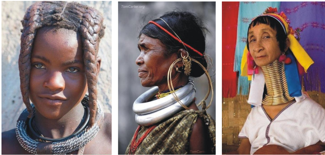
Figura 4. Reprezentări etnografice a inelelor pe gât din Etiopia și Thailanda

În concluzie, inelele de la gâtul statuetei cucuteniene ar putea sugera statutul social al personajelor reprezentate sau ar putea reprezenta mijlocul prin care era atins idealul de frumusețe.