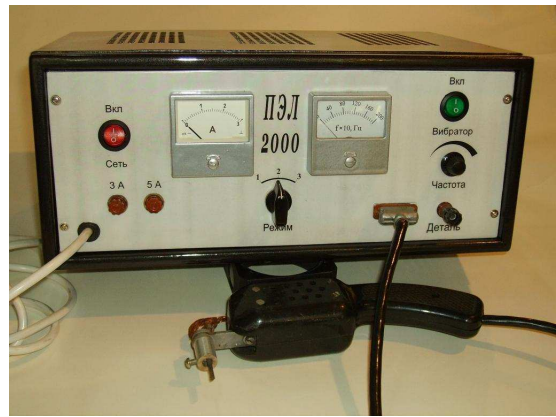
Рис. 2. Установка для электроискрового легирования ПЭЛ-2000.

Поскольку режущий инструмент обычно состоит из двух частей – стальная заготовка и пластина из твёрдого сплава, было разработано два варианта обработки – для сталей и для твердых сплавов.