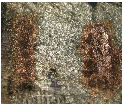
Рис. 4. Поверхность, легированная твердым сплавом и медью.

Возможно наносить покрытие (медь, латунь) на деталь, которая была легирована твердым сплавом (рис. 4). На рисунке показаны результаты легирования на двух режимах – высокочастотном (слева) и низкочастотном (справа).