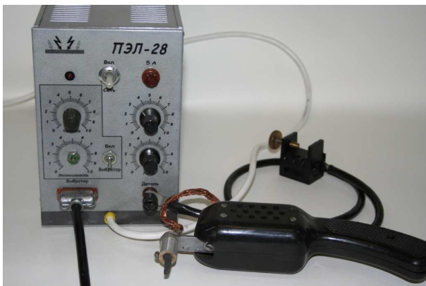
Рис. 1. Установка для электроискрового легирования ПЭЛ-28.

Работа проводилась на установках для электроискрового легирования: универсальной – ПЭЛ-28 (рис. 1) и высокочастотной ПЭЛ-2000 (рис. 2). Отметим, что установка «ПЭЛ-28» используется для работы на грубых режимах [9]: энергия в импульсе – 10-15 Дж, частота – до 200 Гц, толщина наносимого покрытия – до 0,3-0,4 мм. Однако в работах [10, 11] было показано, что для получения сплошного покрытия с малой шероховатостью необходимо повышать частоту обработки. В связи с этим в Институте прикладной физики АН РМ была разработана установка «ПЭЛ-2000» предназначенная для высокочастотного легирования [10]: энергия в импульсе – 1-5 Дж, частота – до 2000 Гц, толщина наносимого покрытия – до 0,1-0,15 мм. Также к ней был разработан новый вибратор, который позволяет работать на частоте до 2000 Гц (в отличие от стандартных, работающих на частотах до 300-400 Гц). В отличие от некоторых установок, которые выпускаются в Молдове и России, в этой установке искровые импульсы синхронизированы с движением вибратора.