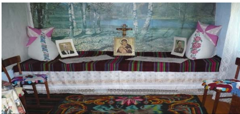
Fig.1 r. Soroca, Căinarii Vechi, fam. Cornei

Această continuitate este demonstrată și prin diferențele dintre raionul Rezina