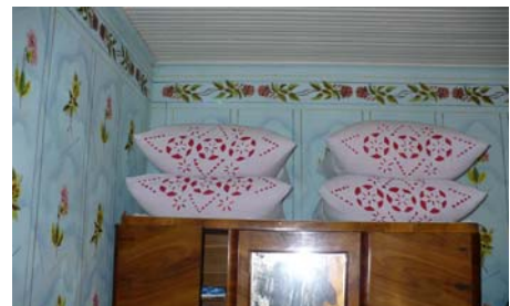
Fig.9 r.Drochia, Hăsnășenii Mari,