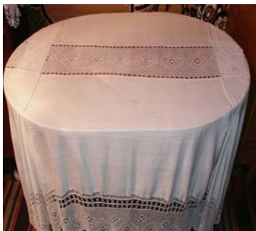
Fig.4 r. Rezina, Horodiște, fam. Pascal

Valorile spirituale care sunt utilizate în ritualurile legate de Casa Mare, sunt reflectate și în obiectele (valorile) materiale care sunt amplasate în acest spațiu, care la rândul lor au o valoare artistică (spirituală).