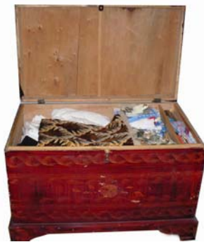
Fig.5 mun. Chisinău, Truseni, fam.