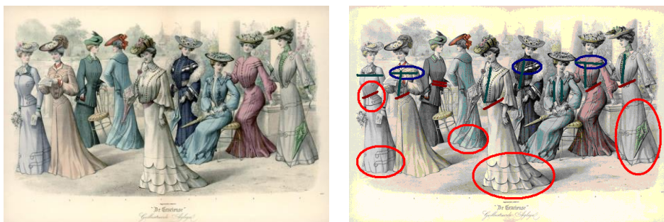
Figura 1: Analiza structurii compoziționale a colecției de costume din revista „Моды сезона”, anul 1910

În colecțiile sau grupurile de modele analizate în perioada de până la Primul Război Mondial analogic exemplului prezentat în figura 1, indiferent de structura și formele complexe ale fiecărui produs suficient de încărcate cu elemente decorative, în întreaga colecție se urmărește ritmul cadențat al formelor costumelor și nuanța liniară a elementelor decorative. În toate colecțiile persistă aceeași linie de siluetă, cu strictețe sunt respectate proporțiile elementelor de bază și, ce este mai important, poziția liniei taliei pentru fiecare produs vestimentar al colecției este aceeași. Însă este de remarcat faptul că fiecare produs în parte prezintă adevărate bijuterii ale modei timpului prin utilizarea elementelor de decor manual de o finețe și inteligență rară.