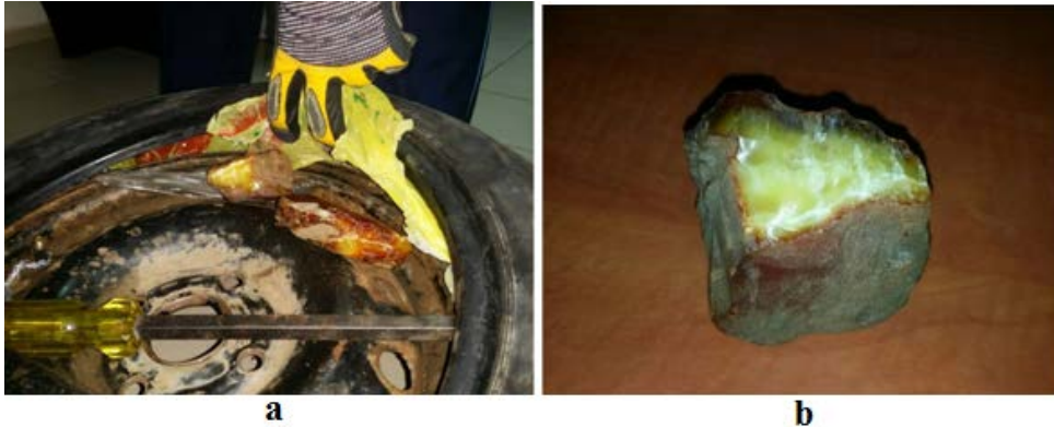
Fig. 5. Chihlimbar ascuns în roata de rezervă aflată în porbagajul unui autoturism descoperit la Punctul Vamal Cahul-Oancea: a – locul de ascundere în anvelopa roții de rezervă; b - fragment de chihlimbar.

b. Disimularea bunurilor culturale prin ascunderea unor bunuri de dimensiuni mici în obiecte mai mari. Avem ca exemplu, cele 10 Kg de chihlimbar ascunse în roata de rezervă a unui autoturism descoperite la Punctul Vamal Cahul-Oancea, ilustrate în figura 5. Pentru acestea nu au fost obținute certificate de export definitiv sau temporar, conform prevederilor legale în vigoare [19];