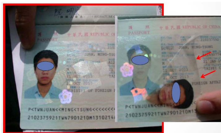
Fig. 2. Pașaport China, vizualizare în lumină albă normală.

Sunt întâlnite uneori și cazuri de documente de călătorie contrafăcute, care pot fi identificate ușor cu ajutorul caracteristicilor unor elemente de siguranță. Un exemplu de identificare rapidă constă în verificarea filigranului folosind lumina transmisă, după care acesta este analizat în UV. Un filigran autentic nu trebuie să fie vizibil la UV, în schimb unul simulat sau contrafăcut este vizibil la UV [10, 11].