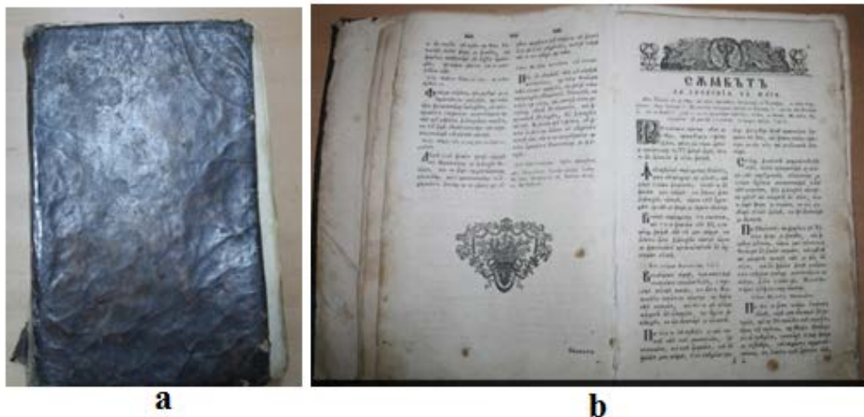
Fig. 6. Carte veche de patrimoniu cultural descoperită la Punctul Vamal Albița-Leușeni: a – coperta; b – deschisă la o anumită pagină

c. Scoaterea bunurilor fără respectarea legislației în domeniu. În acest mod, procedează persoanele care încearcă să scoată bunuri culturale fără certificat de export. Adesea, bunurile nu sunt ascunse, iar la efectuarea unui control de rutină, acestea putând fi ușor identificate. Un astfel de exemplu este ilustrat în figura 6, în care se prezintă o carte bisericească, veche de 150 ani, care face parte din Patrimoniul Cultural National al R. Moldova, descoperită la Punctul Vamal Albița-Leușeni [20].