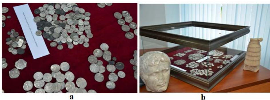
Fig. 4. Bunuri de patrimoniu Cultural descoperite la Punctul Vamal Cahul-Oancea [18]: a – colecție de monede vechi de argint; b – seturi monetare, statueta romană din marmură și statueta antică din alabastru natural.

Ca exemplu, avem lotul de monede de argint medievale (Fig. 4a) și două statuete, una romană din marmură și celaltă din alabastru natural (Fig. 4b), provenite din colecții particulare și care au fost descoperite ascunse în mijloace de transport la Punctul Vamal Cahul-Oancea [18].