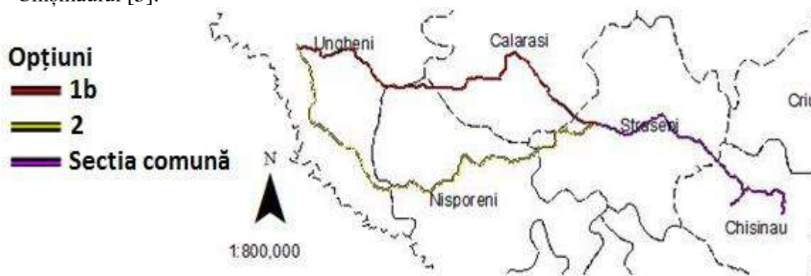
Figura 1. Raioanele traversate de proiect

Proiectul traversează cinci raioane: Opțiunea 1b traversează raioanele Ungheni, Nisporeni, Călărași și Strășeni; Opțiunea 2 traversează raioanele Ungheni, Nisporeni și Strășeni; secțiunea comună traversează raioanele Strășeni și Chișinău [5].