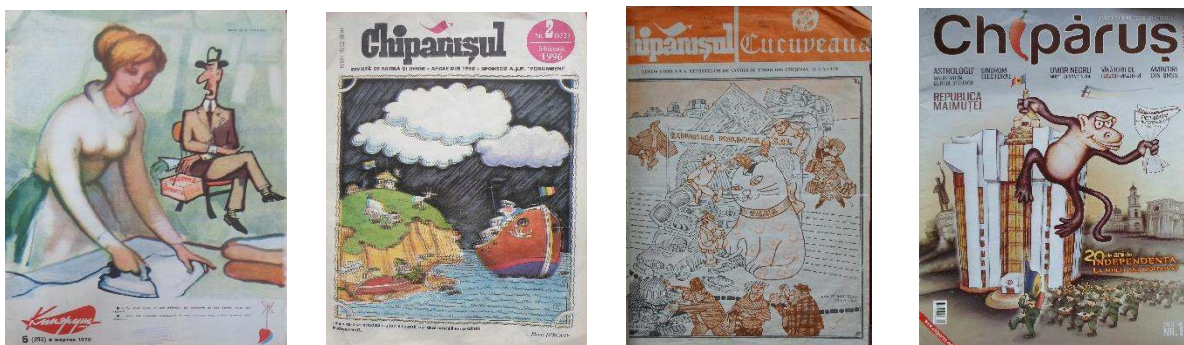
Figura 1. Publicații de satiră și umor