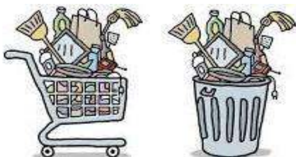
Figura 3. Consumerismul și efectele lui