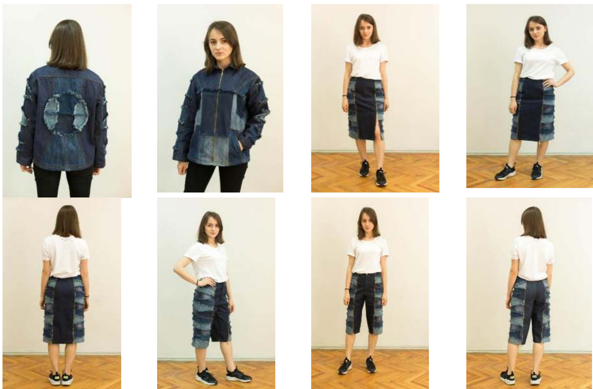
Figura 6. Produse vestimentare pentru tineri confecționate prin reciclare de materiale textile