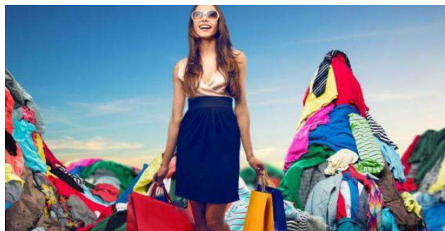
Figura 1. Rezultatul dăunător al modei rapide

Un alt factor important este că la fabricare țesăturile trec prin anumite procese precum vopsirea, albirea și imprimarea, unde se consumă cantități foarte mari de apă și substanțe chimice și se eliberează foarte mulți agenți care sunt extrem de dăunători pentru sănătate. Astfel de