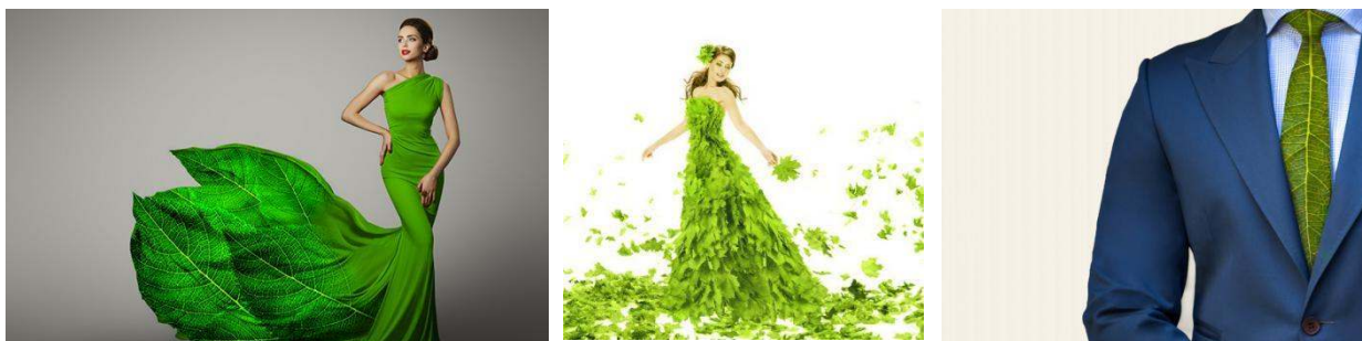
Figura 2. Programul „Îmbracă verde”, publicat de Gemini CAD Systems [2]

Suntem o societate consumeristă, iar publicitatea joacă cel mai important rol în crearea unei societăți consumeriste, pe măsură ce bunurile sunt comercializate cu ajutorul a numeroase platforme în aproape toate aspectele vieții se promovează mesajul că un anumit produs este indispensabil vieții individului [1-3].