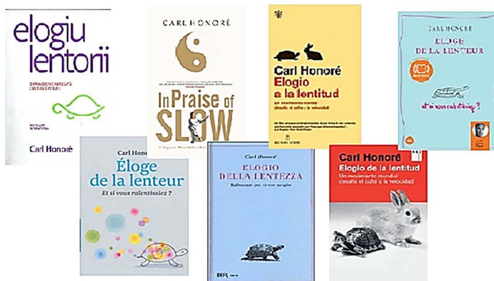
Fig. 1. Doar câteva dintre traducерile în diferite limbi ale cărții publicate de ziaristul canadian Carl Honoré.

cuvенită trecerii timpului. În cuvinte cu un puternic efect emoțional, reprezentativul poet al poporului român, Mihail Eminescu, își îndemna un prezumtiv contemporan astfel: „Tu așază-te deoparte,/Regăsindu-te pe tine,/Când cu zgomote deșarte/Vreme trece, vreme vine.” (Glossă, [2]).