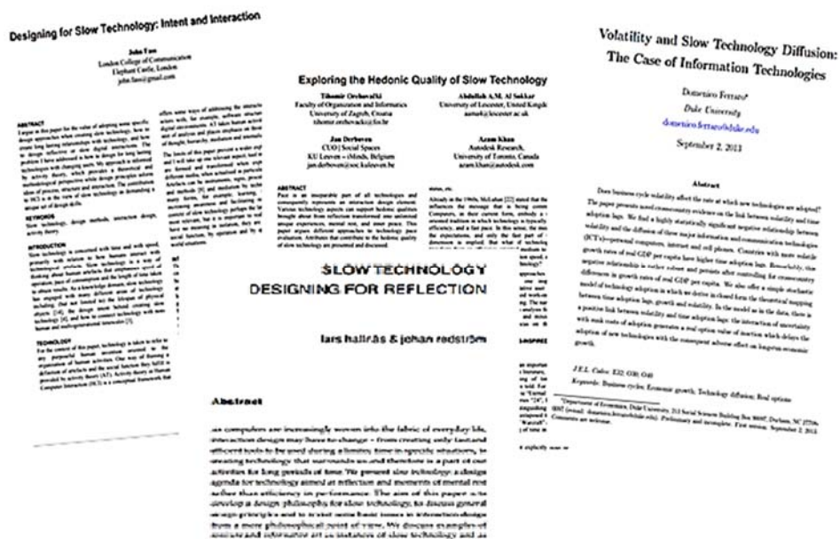
Fig. 4. Lucrări științifice în care este abordată problema încetinirii tehnologiei (referințe: http://www.johan.redstrom.se/thesis/pdf/slowtech.pdf , http://www.willodom.com/slowtechnology/submissions/FINAL/2_JohnFass_cameraReady.pdf , http://www.autodeskresearch.com/pdf/Exploring SlowTechnology.pdf , http://sites.duke.edu/domenicoferraro/personalpage/files/2013/10/ferraro_voltech.pdf )

Filosoful norvegian Guttorm Fløistad (n. 1930) aprecia că „Necesitățile noastre de bază nu se modifică niciodată (necesitatea de a fi apreciat, de a fi apropiat, de a fi îngrijit, de a fi iubit)” și că numai încetinirea (lentoarea) poate recupera și răspunde acestor necesități.