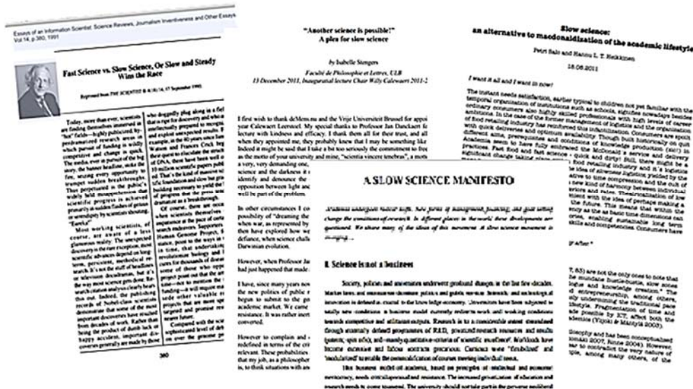
Fig. 3. Lucrări științifice care abordează problema încetinerii în știință (referințe: http://www.cie.ugent.be/vooruitgroep/pdf/slowsciencemanifesto_march13.pdf , http://www.garfield.library.upenn.edu/essays/v14p380y1991.pdf , http://we.vub.ac.be/aphy/sites/default/files/stengers2011_pleaslowscience.pdf , http://slowscience.fr/wp-content/uploads/2011/07/Slow-Science-English-2011.pdf )