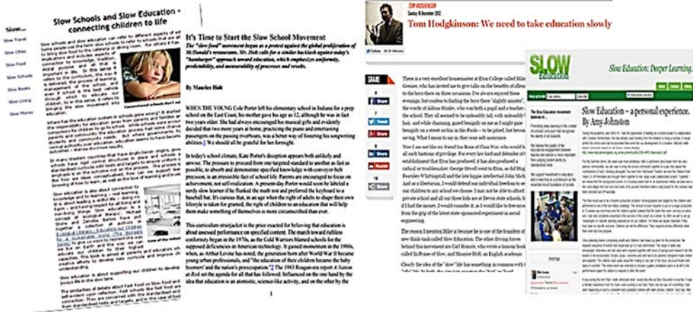
Fig. 2. Câteva lucrări științifice care abordează problemele educației încetinite (referințe: http://www.slowmovement.com/slow_schools.php , http://www.bluegum.act.edu.au/links/Maurice_Holt_Slow_Schools.pdf , http://www.independent.co.uk/voices/commentators/tom-hodgkinson-we-need-to-take-education-slowly-8412116.html , http://sloweducation.co.uk/2014/02/04/slow-education-a-personal-experience-by-amy-johnston ).