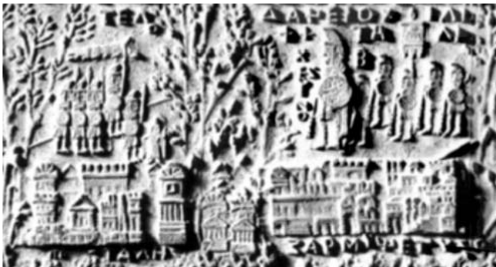
Fig. 5. Tăblița 84- detaliu cu palatul lui Burebista și al lui Decebal de la Sarmisegetuza.

În tăblița 84, care se referă la situația din timpul luptelor cu împăratul Traian, este prezentat din nou un palat din timpul lui Decebal care, însă, este situat spre dreapta față de palatul lui Burebista cel prezentat în figura 2. În detaliul din tăblița 84 din figura 5 se poate observa atât palatul lui Burebista și cel al lui Decebal care are o formă diferită de cel din tăblița 94. În această tăbliță este descrisă situația de la Sarmisegetuza după moartea lui Decebal, când această cetate nu a fost încă ocupată de romani.