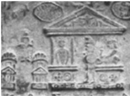
Fig. 19. Detaliu din tăblița 17.

putea să reprezinte o mumie menținută în picioare. În tăblița 18, care are situat în centru imaginea acestui edificiu, textul începe cu „ Faxo zesa Marico... ”, care se poate traduce prin „ Bandajul (mumia) zeiței Marica... ”, după care, se arată că i-ar fi anunțat pe oameni despre viitoarea reînviere a fiului ei, adică a lui Zamolsxis. În figurile 19, 20 și 21, sunt prezentate imagini ale unor temple asemănătoare din tăblițele 17, 69, 72, 92 și 96.