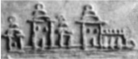
Fig. 16. Detaliu din tăblița 67- dreapta - un alt palat al goților de la Zeiosy Dava.

În tăblița 67 se face referire la goți și locul în care se situau aceștia. Tinând seama și de conținutul tăbliței 109 se poate afirma că aceștia se aflau undeva în nord-estul Moldovei. În figurile 15 și 16 sunt prezentate detalii din tăblița 67, reprezentând două edificii care au aparținut goților.