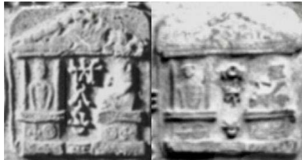
Fig. 20. Detalii din tăblițele 69 și 72

Tăblița 17 se referă la aducerea capului lui „ Ion al Geei ” și a mumiei zeiței Marisa de la „ Muntele Sfânt ” la Sarmisegetusa. Este posibil ca denumirea râului Mureș să provină de la această zeiță.