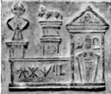
Fig. 24. Detaliu din tăblița 14- templul de la Elia Carseoy.