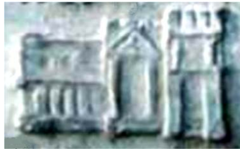
Fig. 22. Detaliu din tăblița 39 – Sediul lui Deceneu de la Sarmisegetuza.

În tăblița 39 se poate vedea sediul lui Deceneu de la Sarmisegetuza, care poate fi observat și pe mijlocul palatului de la Sarmisegetuza reprezentat în figurile 2 și 5.