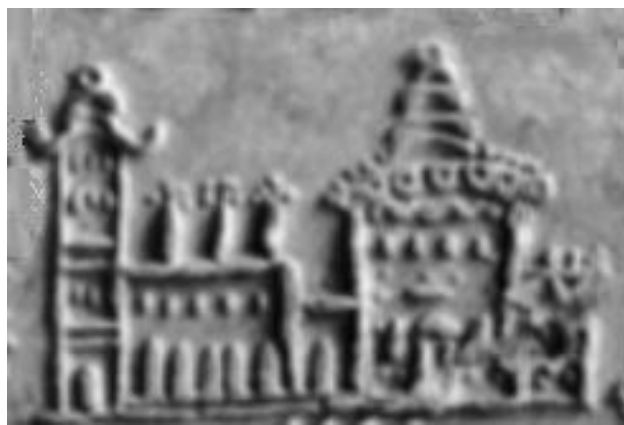
Fig. 15. Detaliu din tăblița 67-stânga - un palat al goșilor de la Zeiosy Dava.

Domitian și în timpul lui Traian. În timpul lui Burebista romanii lui Caius Antonus au trecut și ei prin această așezare.