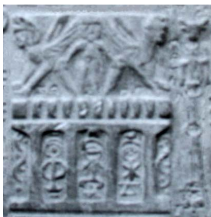
Fig. 13. Detaliu din tăblița 6- altarul lui Apollo de la Poesta Dava.