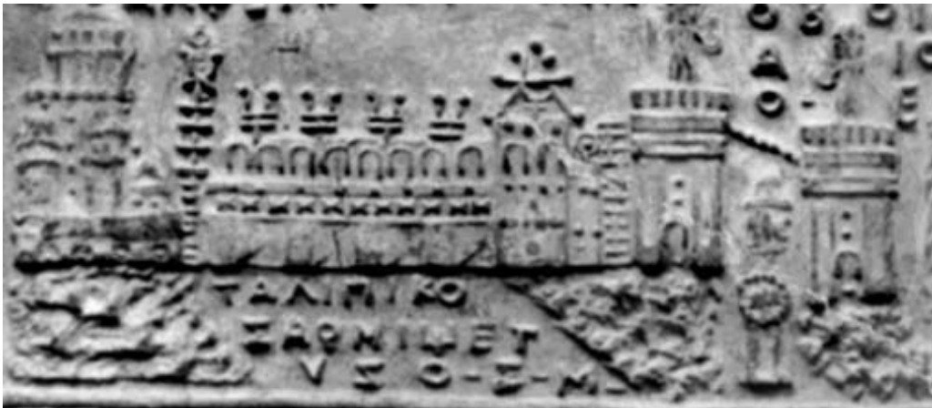
Fig. 4. Täblița 94- detaliu cu palatul lui Decebal de la Sarmisegetuza.

amplasat pe malul unei ape, posibil Mureșul, astfel încât, pentru a trece spre palat trebuia traversat un pod. Un detaliu cu palatul lui Decebal este prezentat în figura 4, în care se poate distinge cu claritate inscripția „ΤΑΛΠΙΚΟ ΣΑΡΜΙΨΕΤΥΖΟ”, care se traduce prin „Palatul de la Sarmisegetuza”.