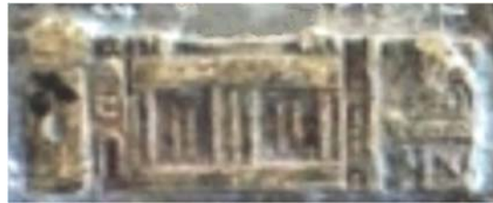
Fig. 23. Detaliu din tăblița 52- posibil templul Geei de la Mont Gato

Un centru important al geto-dacilor a fost templul Geei de la Mont Gato. La acest templu venea și Burebista să citească despre învățăturile atlantiților despre