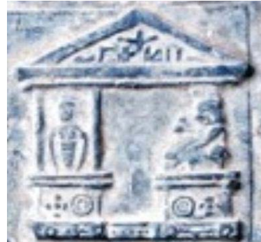
Fig. 18. Detaliu din tăblița 18 și 117- templul Maricăi dela Moleo Dava.

putea să reprezinte o mumie menținută în picioare. În tăblița 18, care are situat în centru imaginea acestui edificiu, textul începe cu „ Faxo zesa Marico... ”, care se poate traduce prin „ Bandajul (mumia) zeiței Marica... ”, după care, se arată că i-ar fi anunțat pe oameni despre viitoarea reînviere a fiului ei, adică a lui Zamolsxis. În figurile 19, 20 și 21, sunt prezentate imagini ale unor temple asemănătoare din tăblițele 17, 69, 72, 92 și 96.