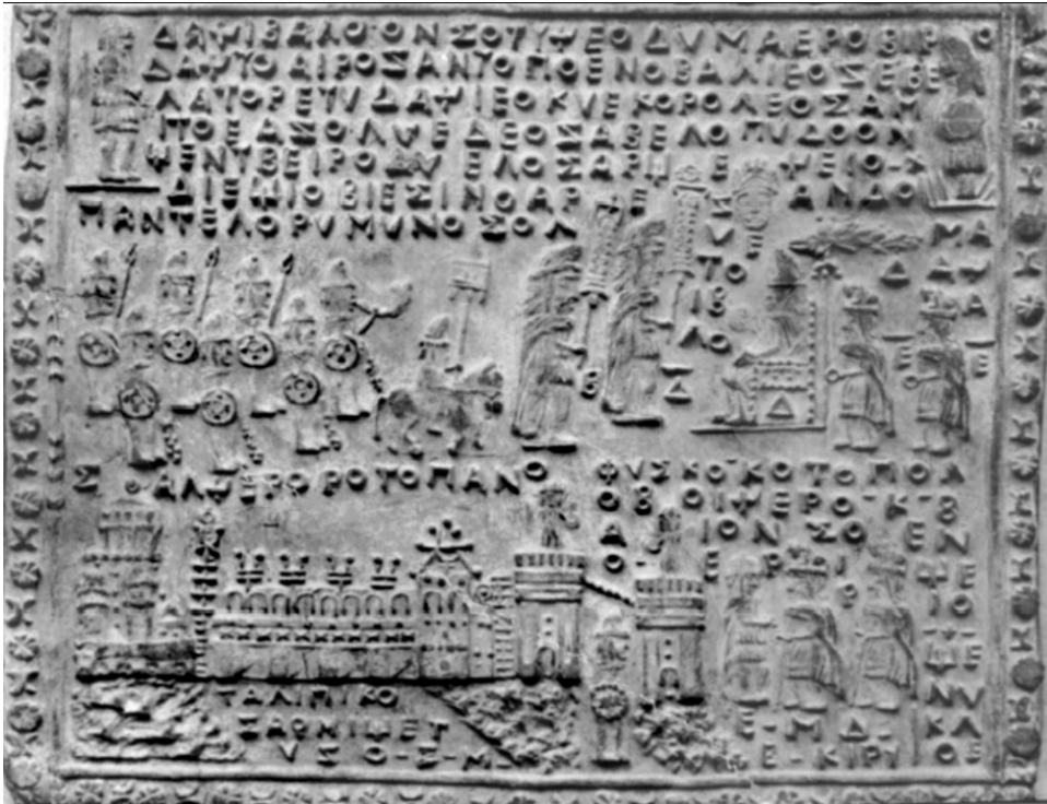
Fig. 3. Täblița 94. Decebal și generalii săi cu armatele lor la Sarmisegetuza.

amplasat pe malul unei ape, posibil Mureșul, astfel încât, pentru a trece spre palat trebuia traversat un pod. Un detaliu cu palatul lui Decebal este prezentat în figura 4, în care se poate distinge cu claritate inscripția „ΤΑΛΠΙΚΟ ΣΑΡΜΙΨΕΤΥΖΟ”, care se traduce prin „Palatul de la Sarmisegetuza”.