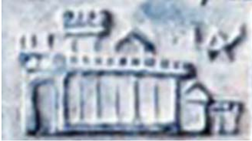
Fig. 8. Detaliu din tăblița 117- edificiul de la Moleo Dava cu ideogramă.