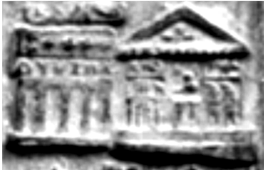
Fig. 17. Detaliu din tăblița 17- templul lui Ro de lângă Sarmisegetusa.