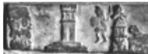
Fig. 11. Alt detaliu cu turnul de la Mont Gato.

O altă așezare getică importantă a fost la Poesta Dava, pe Argeș, care, conform tăbliței 35, este legată de