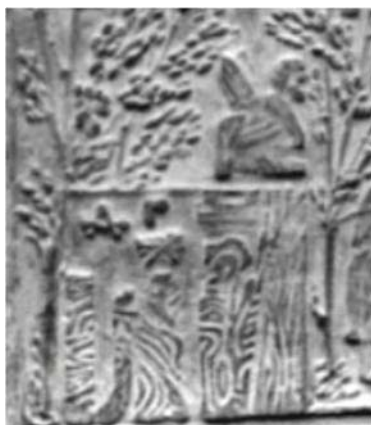
Fig. 14. Detaliu din tăblița 72- altarul lui Apollo de la Poesta Dava văzut din lateral.