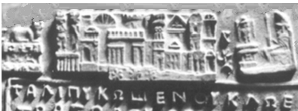
Fig.6. Detaliu din tăblița 79 - palatul de la Genucla.

Edificii importante ale geto-dacilor au existat și în alte locuri, nu numai la Sarmisegetuza; astfel, pe malul drept al Dunării, în zona de nord a Dobrogei a existat cetatea Genucla, menționată deseori în tăblițele de la Sinaia. În figura 6 este