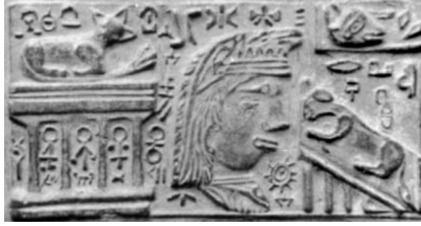
Fig. 25. Detaliu din tăblița 20 - Altarul bastarnilor care l-au adoptat pe zeul Ro.

Concluzii: Tăblițele de la Sinaia conțin reprezentări ale unor edificii importante care sunt însoțite și de informații legate de existența lor. Identificarea acestor edificii și a evenimentelor de care sunt legate pune în evidență complexitatea vieții social-politice de la începuturile istoriei din zona carpato-danubiană și balcanică a Europei.