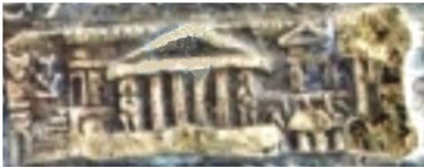
Fig. 7. Detaliu din tăblița 52- posibil palatul lui Deceneu de la Genucla.

În tăblița 79, Deceneu arată vitejia cu care geții au luptat împotriva romanilor și afirmă că locuitorii Siretului au păstrat scrieri realizate prin imprimare de către atlanți referitoare la „ învățăturile despre faptele oamenilor ”. Deceneu a fost Mare Preot la Moleo Dava, apoi la Genucla și, în final, la Sarmisegetusa. După moartea lui Burebista, a luat măsuri pentru pedepsirea celor vinovați și a avut grijă de fiul lui Burebista să fie trimis la Genucla de unde era, probabil, familia sa. La Genucla, Deceneu primea în „ audiență ” personaliiști ale timpului, inclusiv pe Burebista, la palatul său reprezentat în figura 7, preluat din