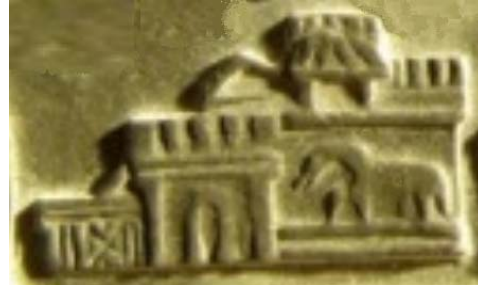
Fig. 9. Detaliu din tăblița 42- edificiul de la Moleo Dava văzut din direcție opusă față de cea din figura 8.

leopardului cetatea getilor sciți ". De aici rezultă că locuitorii cetății mai erau numiți și geți sciți. În alte tăblițe cetatea mai este menționată prin inițialele S.M.G.D.S.G., sau Sar Sihto Logo și Sar Sihto Zavio adică „țara celor șase cuvinte”.