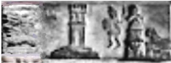
Fig. 10. Detaliu din tăblița 25 - turnul de la Mont Gato.

În legătură cu cetatea Moleo Dava, în partea din dreapta-jos a tăbliței 25, și în tăblița din anexa de la cartea lui Romalo este reprezentat un turn a cărui imagine este redată în figura 10. În detaliul din figura 10 se poate observa în