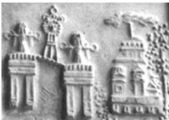
Fig. 12. Detaliu din tăblița 65-Poesta Dava

La Poesta Dava, pe Argeș, a existat un templu important dedicat lui Apollo. În figurile 13 și 14 se poate vedea cum arăta acest templu văzut din față și din lateral. La Poesta Dava au avut loc bătălii importante cu romanii în timpul lui