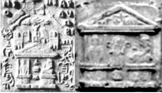
Fig. 21. Detalii din tăblițele 92 și 96.