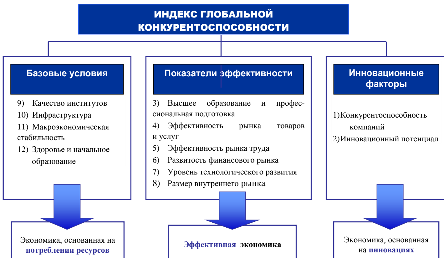
Рис. 1 Схема Индекса Глобальной Конкурентоспособности [2]

расчета Индекса для того, чтобы он оставался адекватным инструментом измерения уровня конкурентоспособности в постоянно меняющейся глобальной среде.