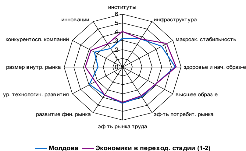
Рис. 2 Сравнительные величины ИГК Молдовы и стран с переходной экономикой, 2013 г.

В 2013 г. Молдова также имеет относительно высокие показатели по макроэкономической среде (77 место), инфраструктуре (88 место), высшему образованию и тренингам (90 место), эффективности рынка труда (95 место).