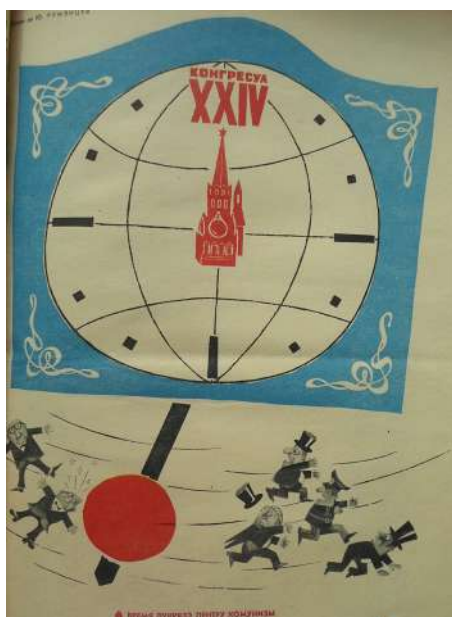
Fig. 3. Vremea lucrează...