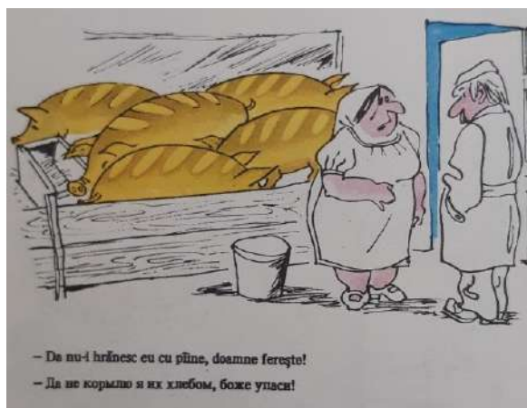
Fig. 6. Da nu-i hrănesc eu cu pâine...

1. Rocaciuc V. Artele plastice din Republica Moldova în contextul sociocultural al anilor 1940-2000 . Chișinău: editura Atelier, 2011.