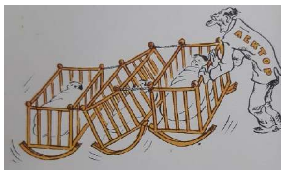
Fig. 7. Lector.