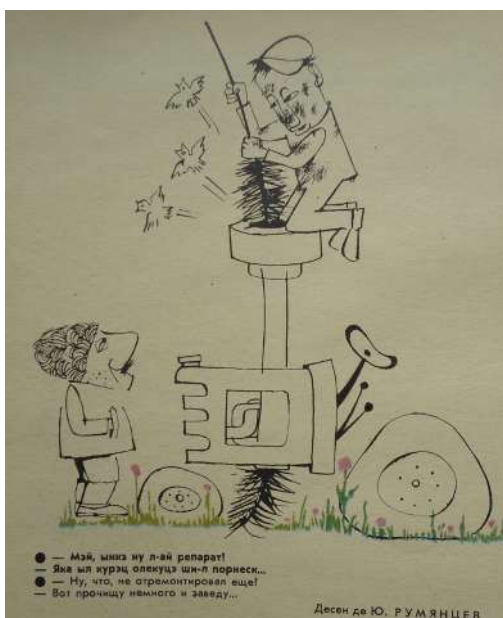
Fig. 10. Încă nu l-ai reparat?