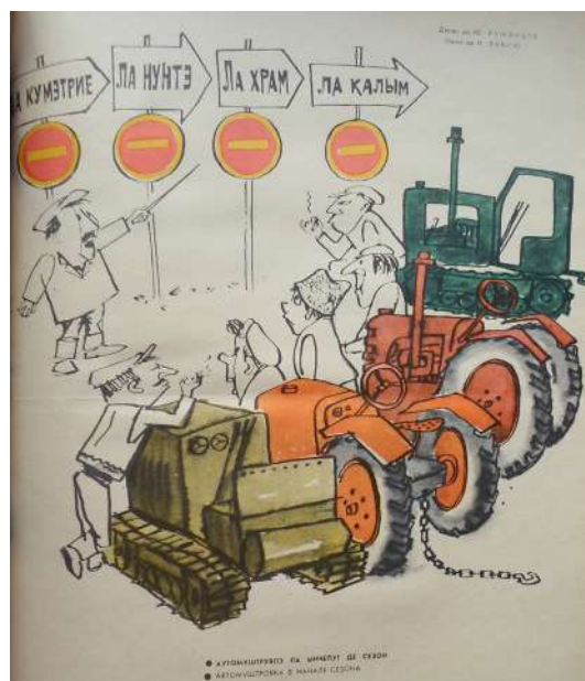
Fig. 11. Automuștruială...

nin” (or. Moscova). O parte dintre lucrările artistului au fost prezentate la expozițiile organizate în Bulgaria, Cehoslovacia, Republica Democrată Germană.