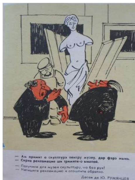
Fig. 4. Am primit o sculptură pentru muzeu...

mai bune practici în agricultură. Imaginile seriei sunt tratate printr-un limbaj plastic laconic, acompaniat generos de o linie destinată evidențierii figurilor umane, celor mai importante detalii și totodată, poartă prin sine însăși coordonate plastice originale, valori estetice și semantice importante. Alături de culoare și linie, plastica mișcărilor, dar și a pozițiilor, vin să dezvăluie emoțiile și experiențele sufletești ale personajelor. Seria în cauză, precum și alte lucrări similare ale graficianului, răspund „...sarcinilor puse în fața creatorilor de opere, fiind apropiate și clare pe înțelesul poporului, ilustrând viața Moldovei Sovietice...” [1, p. 68]. Totodată, aceste lucrări se înscriu în registrul temelor tradiționale ale epocii și anume „Tema muncii și a atitudinii față de aceasta”. Lucrările la tema respectivă erau orientate spre educarea în om a atitudinii responsabile față de munca pe care o exercită, iar caricaturile de pe paginile edițiilor periodice promovau în masele largi ale populației idei de încurajare la acțiuni optimiste prin determinarea unor norme de comportament cotidian adecvat. Personajele centrale în astfel de caricaturi erau imaginile leneșului, chiulangului, cârpaciului, ș.a.