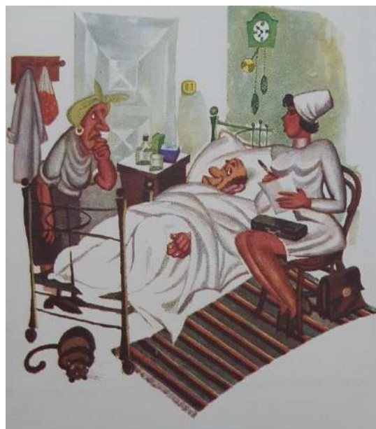
Fig. 9. Eu am să-i eliberez foaie de boală...