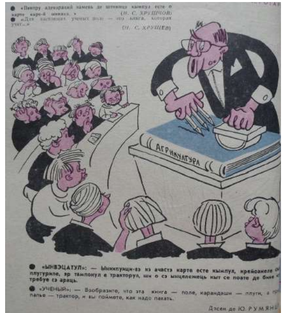
Fig. 2. Învățătul.

Graficianul a publicat frecvent caricaturi și pe paginile revistei „Femeia Moldovei”. În imaginile satirice pictorul abordează teme de morală, cultură și cotidian. Motivele caricaturilor elaborate de către artist sunt constituite din multiple personaje și situații comice, reliefate prin intermediul unor pronunțate particularități dinamice. În acestea pictorul valorifică iscusit însușiri umane precum: sânguința, perseverența, hărnicia, devotamentul, modestia, lenevia, impertinența, lingușeala, ș.a. dând dovadă de perseverență și profund spirit de observație, de asemenea și de o vastă cunoaștere a modului de reprezentare plastică a diverselor accesorii ce completează imaginile: bijuterii, accesorii vestimentare, obiecte, piese ale unităților de transport, facturi ale diferitor materiale. Așa, în caricatura Trântorii (fig. 1) Iurie Rumeanțev reprezintă un stup de albine unde doi trântori – simbol al leneviei, trândăviei – sunt cei, care vor să decidă pe care dintre albine, simbol și metaforă plastică ce reprezintă persoanele active, muncitoare, harnice și mereu ocupate, să o concedieze. În acest fel, artistul dezvăluie într-o manieră ironică asemănări cu situații întâlnite în societate, „biciuind” părțile negative din cotidian. Mesajul caricaturii este artistic încifrat într-un „ambalaj” zoomorf și este unul atemporal.