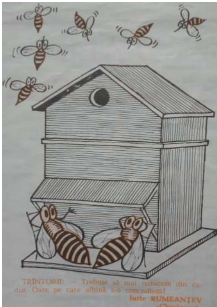
Fig. 1. Trântorii.