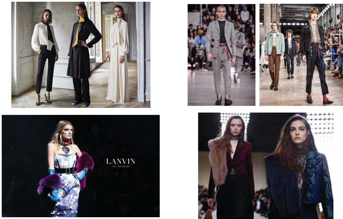
Fig. 3. Colecțiile vestimentare caracteristice Casei de modă Lanvin

Marc Jacobs - Colecțiile create sunt axate pe Moda feminină în cea mai mare măsură, sunt utilizate texturi individuale sau texturi care ulterior se modifică cu paiete, pictură pe material, copci, fermuare etc. Designerul bradului Marc Jacobs pune accentul frumusețe neordinară cu ajutorul motivelor impresionante, el afirmă „ Eu încerc să caut frumusețea în lucrurile neordinare sau bizare pentru unii, pentru mine cel puțin ele sunt cu mult mai atrăgătoare decât perfecțiunea spre care tinde atât de multă lume” (fig. 4).