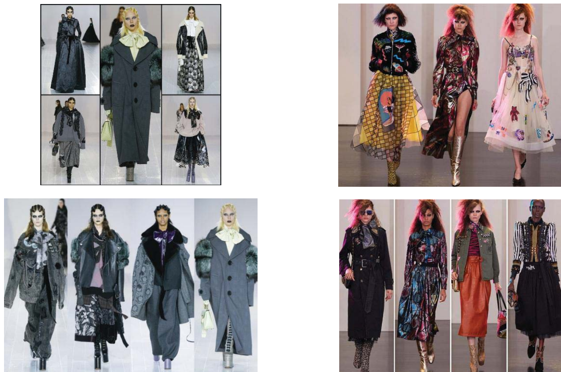
Fig. 4. Colecțiile vestimentare caracteristice Casei de modă Marc Jacobs

Marc Jacobs - Colecțiile create sunt axate pe Moda feminină în cea mai mare măsură, sunt utilizate texturi individuale sau texturi care ulterior se modifică cu paiete, pictură pe material, copci, fermuare etc. Designerul bradului Marc Jacobs pune accentul frumusețe neordinară cu ajutorul motivelor impresionante, el afirmă „ Eu încerc să caut frumusețea în lucrurile neordinare sau bizare pentru unii, pentru mine cel puțin ele sunt cu mult mai atrăgătoare decât perfecțiunea spre care tinde atât de multă lume” (fig. 4).