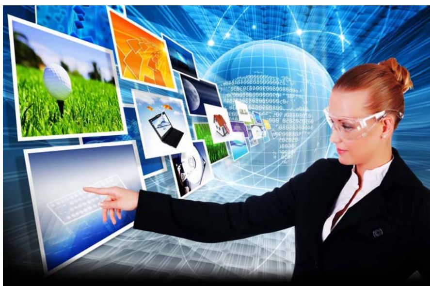
Рис.1 – Цифровые технологии.

Создание технологий онлайн-обучения, которые могут быть применены для обучения студентов в вузе – это все разнообразие цифровых технологий, которые применяются и для проведения синхронных занятий, и для проведения проектного обучения, проектных практикумов, и для сбора интерактивной обратной связи для проведения виртуальных лабораторий. Все разнообразие этих технологий позволит привнести в образовательный процесс новые интересные возможности. Вуз, который хочет занять свою нишу на образовательном рынке, который предоставляет возможности для построений индивидуальных образовательных траекторий, для создания интерактивной среды, для проектного практикума – обязан использовать цифровые технологии для того, чтобы этот процесс был качественным (Рис. 1).