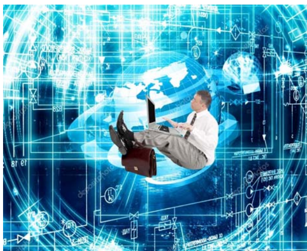
Рис. 3 - Огромные возможности онлайн-образования.

Вне зависимости в каком формате студент будет получать образование, он должен хотеть учиться, он должен стремиться к знаниям, он должен быть трудолюбивым – это основные качества, которые позволят действительно получить образование, а не провести время путем образовательного процесса. Нужно развивать самодисциплину не только для онлайн образования – это ключевое качество для жизни, и это качество нужно воспитывать также путем онлайн-образования, можно ввести дополнительный курс, можно дополнительно изучать какие-то психологические тонкости образовательного процесса для того, чтобы повышать эффективность и повышать самостоятельность студентов в процессе обучения. Онлайн образования дает студенту огромные возможности, в первую очередь – это возможность конкретного освоения тематики дистанционным путем экономя время и таким образом освобождая дополнительные ресурсы для углубленного обучения (Рис.3).