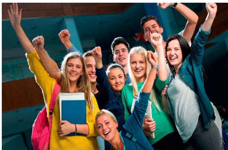
Рис. 4 – Студенчество – особый неповторимый мир

Интернет-обучение помогает раздвинуть границы, расширить образовательные возможности и создать условия для непрерывного обучения на протяжении всей жизни. Интернет-обучение помогает быстро получать информацию, работать с ней, включать в свою профессиональную деятельность, позволяет в краткие сроки освоить новую специальность, получить навык и задействовать ресурсы для личного развития. Но, большинство студентов хотят учиться очно потому, что вуз это возможность прикоснуться к великому, реализовать свои идеи и обрести связи на всю жизнь, потому что вуз — это особый неповторимый мир, а студенческая жизнь — это особое неповторимое время в нашей жизни (Рис.4).