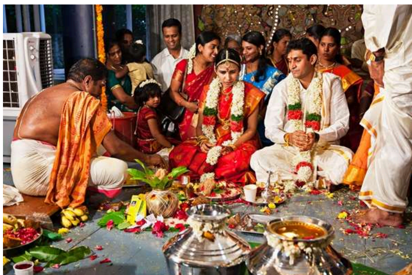
Figura 4. Nunțile în India