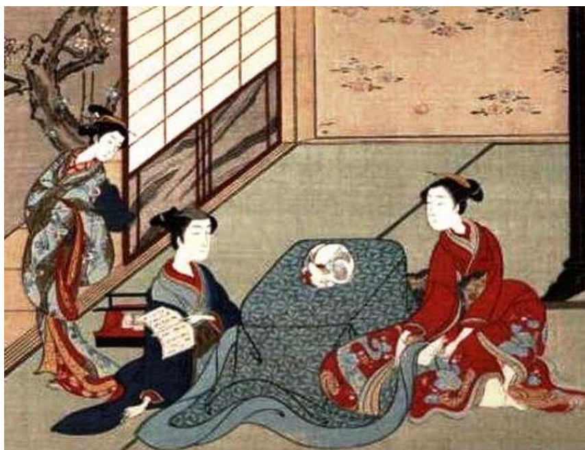
Figura 1. Ilustrație a mesei tradiționale din poporul japonez

Japonezii, încă din cele mai vechi timpuri utilizează mesele de înălțimi mici (Fig. 1), înălțimea acestora fiind în jur de 30cm. La astfel de mese aceștia i-au masa atât în componență de 2-3 persoane, cât și în componență mai mare, la diverse ceremonii sau întruniri de familie. La astfel de mese, aceștia pot sta atât pe podea, cât și pe perne pe post de scaune. Aceste mese pot avea diverse forme, însă forma clasică, este masa japoneză pătrată (Fig. 2).