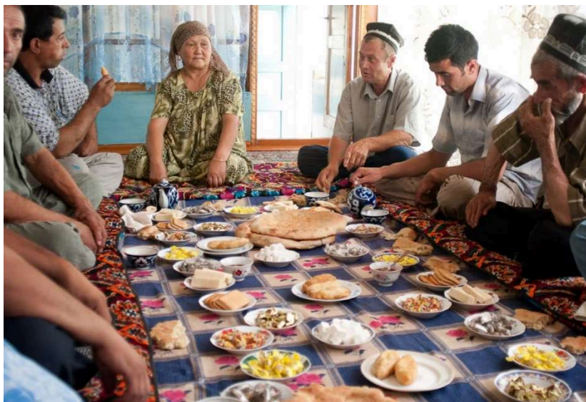
Figura 3. Luarea mesei la indieni.

Partea cea mai mare a populației totuși are un venit mai mic, astfel încă din cele mai vechi timpuri, indienii sunt obișnuiți să mănânce pe podea. Farfuriile cu bucatele sunt aranjate pe pături, iar oamenii se așează pe perne împrejurul bucatelor (Fig. 3).