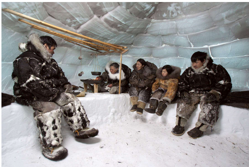
Figura 6. Luarea mesei în Iglu