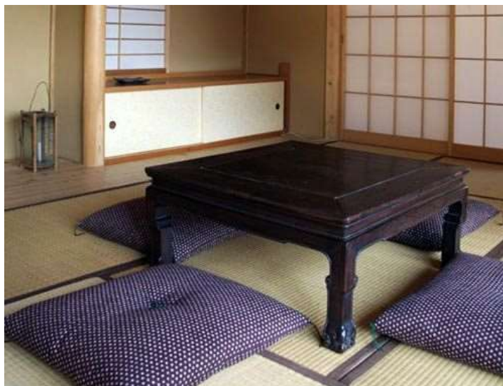
Figura 2. Masă japoneză cu perne

La astfel de mese se servesc bucatele tradiționale și de asemenea se servește și ceaiul, ce este un element foarte important în cultura japoneză [2].