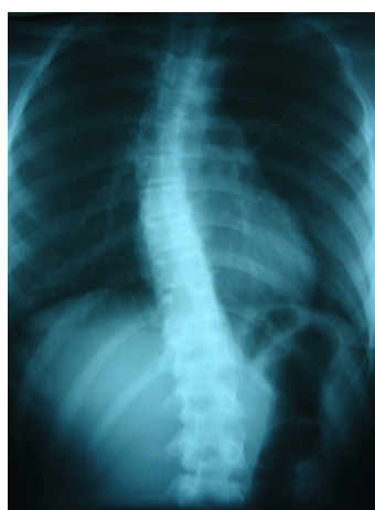
Figura 2. Reprezentare imagistică a scoliozei