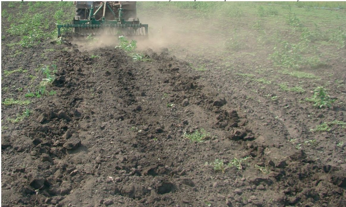
Рисунок 3. Общий вид почвы после обработки чизельным плугом ПЧ-2,5

семян была меньше на 0,4–0,9% по сравнению с другими вариантами (табл. 2). Такая тенденция сохранялась и в период всходов сои – содержание влаги в десятисантиметровом слое почвы, наиболее важном для формирования всходов, было на пахоте меньше на 2,3–5,6%. В связи с этим густота растений на этом варианте опыта была меньше, чем на вариантах с безотвальной обработкой. Наибольшая плотность растений и полевая всхожесть наблюдались на варианте локального рыхления почвы на глубину 40 см с расстановкой лап через один метр – 76,6%. Это