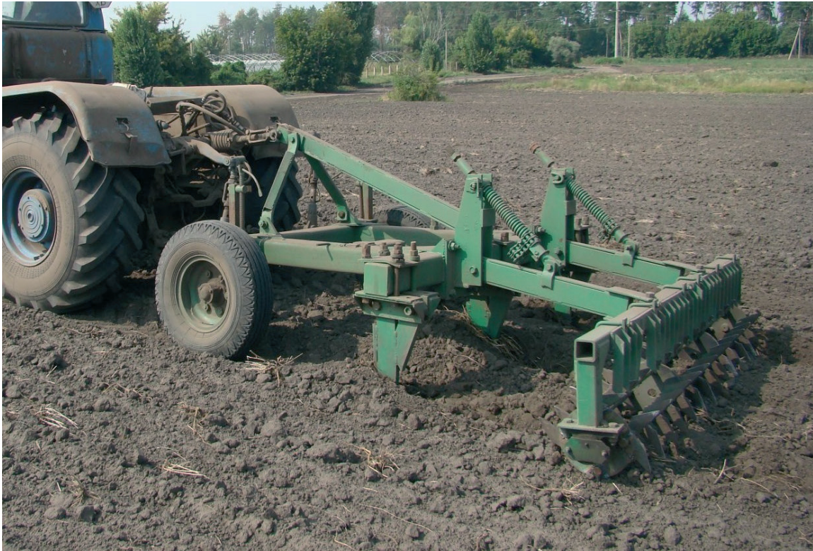
Рисунок 2. Обработка почвы чизельным плугом с разным расстоянием между стойками