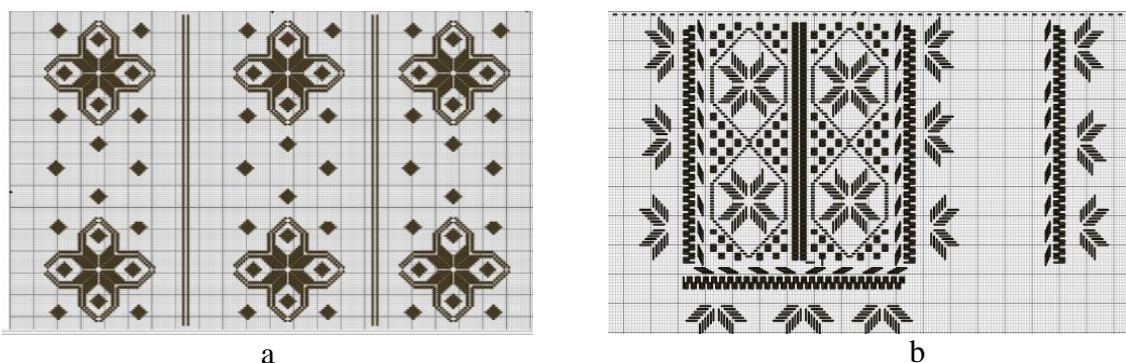
Figura 2. Schema motivelor de brodat a bluzelor pentru femei (a) și a cămășii pentru bărbați (b).

Pentru a elabora schemele broderiilor de decorare a bluzelor, s-a utilizat programul „Pattern Maker for Cross Stitch”[8], unde s-a efectuat elaborarea manuală a ornamentului după introducerea și completarea ornamentului s-a obținut următoarele scheme pentru elementele față, mânecă și bentiță rascroielii gâtului, a bluzei pentru femei și schema pentru elementele față, guler și manșetă a cămășii pentru bărbați (fig.2).