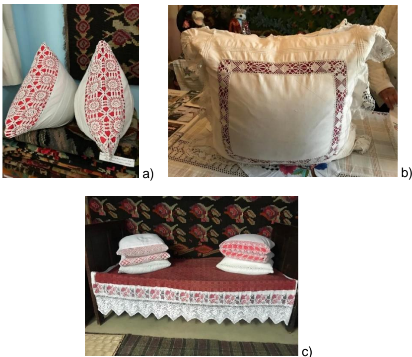
Figura 2: Fețe de perne ceremoniale și ritualice; a- Muzeul de Istorie și Etnografie, Călărași; b- filiala Muzeului Lazăr Dubinovschi, satul Risipeni, Florești;; c-Muzeul Ținutului Cahul.

Exemple de realizare a pernelor și fețelor de perne de ceremoniale și ritualice sunt cele utilizate în evenimentele ce marchează etapele importante din viața oamenilor cum ar fi: nașterea, căsătoria și decesul.