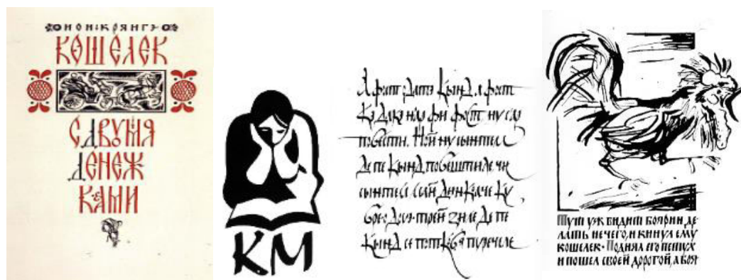
Figura 4. Ilustrații elaborate de Ilie Bogdesco la povestea lui Ion Creangă “Punguța cu doi bani”

Artistul redă într-un mod inedit emoțiile personajelor ce ușor pot fi recunoscute ca provenind din mediul satului cu toate întâmplările sale cotidiene. Recurgând la reproducerea textuală caligrafică a operii lui Ion Creangă, acestea stilistic completează armonios imaginile asigurând echilibru între text și grafică. Emoțiile personajelor ilustrate de Ilie Bogdesco sunt amplificate de alternarea constituirii structurale compoziționale în același încadrament regăsind structuri mixte de compoziții de tip închis și deschis.