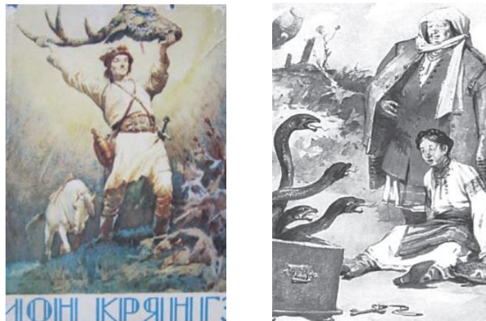
Figura 1. Ilustrații realizate de Leonid Grigorașenco la ediția de carte intitulată "Povești" de Ion Creangă

În colecția de lucrări realizate în acuarelă cu aspect realist, impresia este sporită de culorile vibrante și de tehnica de pictură cu pensula care creează un efect de întretăiere. Leonid Grigorașenco descrie realitatea atât de credibil, încât nu există nici o îndoială în întâmplările ilustrate – o calitate foarte valoroasă într-o carte pentru copii. Către sfârșitul anilor 1950, desenele lui Leonid Grigorașenco au trecut printr-o noua etapa a creației grafice. Au devenit mai minimaliste, folosind mai multe linii grafice și pete abstracte pentru a reda umbrele. Aceste desene au fost adesea utilizate ca frontispicii sau viniete în cărțile în care apăreau compoziții mai ample realizate în acuarelă. Mixul între desenele în alb-negru și cele în acuarelă au creat o armonie unică în designul cărților ilustrate de plasticianul Leonid Grigorașenco.