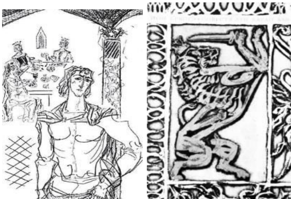
Figura 5. Ilustrații elaborate de Gheorghe Vrabie la povestea lui Ion Creangă “Harap Alb