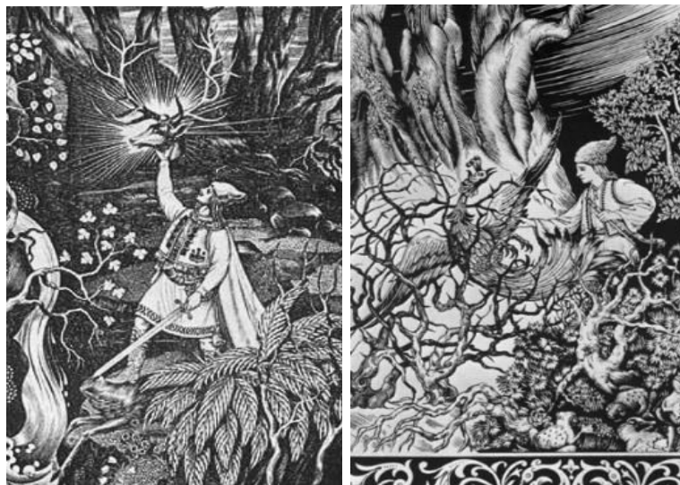
Figura 2. Ilustrații realizate de Boris Nesvedov la povestea “Harap Alb” de Ion Creangă