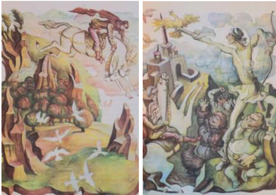
Figura 6. Ilustrații realizate de Filimon Hămuraru la povestea “Harap Alb”