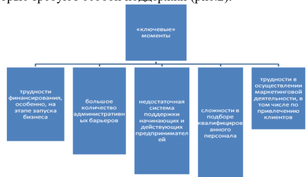
Рис. 2. Ключевые моменты, требующие поддержки, согласно опросам в ЕС-28

Запуску тех или иных программ в целом предшествовали масштабные опросы (интервью) представителей микробизнеса. В ходе опросов были выявлены наиболее важные «ключевые» моменты, которые требуют особой поддержки (рис.2).