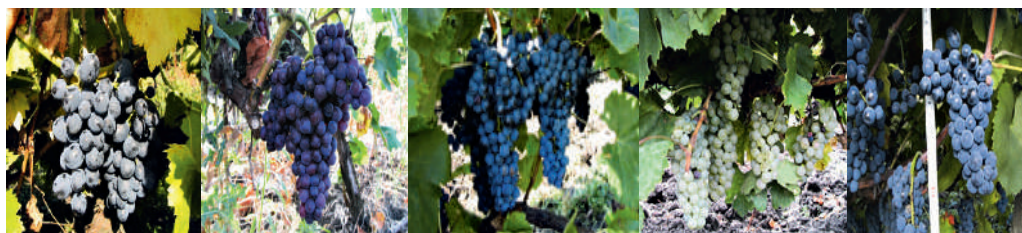
Figura 1. Soiul 'Moldova'

Pentru înființarea unei plantații în sistem ecologic se recomandă următoarele: amenajarea parcelelor și a canalelor de desecare fără impact negativ asupra mediului; se fac analize de sol complete înainte de plantare și în funcție de rezultate se execută fertilizarea cu produse autorizate; înierbarea suprafeței cu un an înainte de plantare; evitarea lucrării solului prin răsturnarea brazdelor; plantarea se face numai cu material biologic certificat; alegerea solului, portaltoiului se face în funcție de potențialul arealului; limitarea lungimii rândului se face în funcție de panta terenului; forma de conducere se adaptează în funcție de soiul vinifera și condițiile locale; se asigură echilibrul de creștere și producția de struguri; programele de combatere fitosanitară se fac conform conceptului de producție ecologică prin limitarea riscurilor de poluare și respectarea reglementărilor privind securitatea metodelor de administrare a produselor fitofarmaceutice.