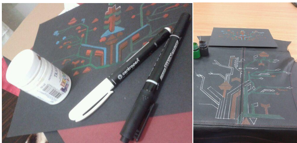
Figura 3. Procesul de realizare a decorului modelului realizat