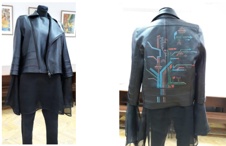
Figura 2. Aspectul exterior (față și spate) al ansamblului realizat

Soluționarea stilistică a produsului se atribuie liniei rock datorită: siluetei drepte, prezența detaliilor decorative, folosirea pielii negre. Metodele de prelucrare tehnologică au fost selectate în conformitate cu particularitățile materialului și destinația produsului. Datorită produsului, mai puțin bogat ornamentat, ținuta posedă o alură casual cât și una rock care relevă o viziune inedită asupra portului tradițional basarabean.(fig. 2, 3).