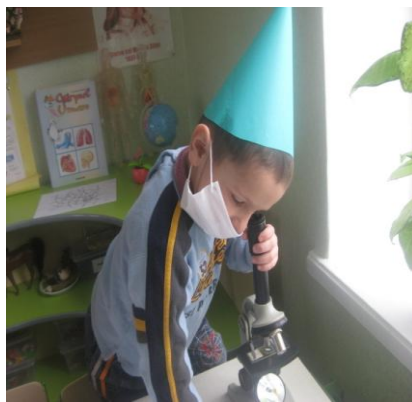
Lucrul la Centrul Știință. Chiat este un microb?