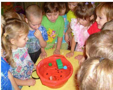
Lucrul la Centrul Știință. Primele experimente. Plutește sau se îneacă? Lucrul la Centrul Știință. Amestecând lichide.