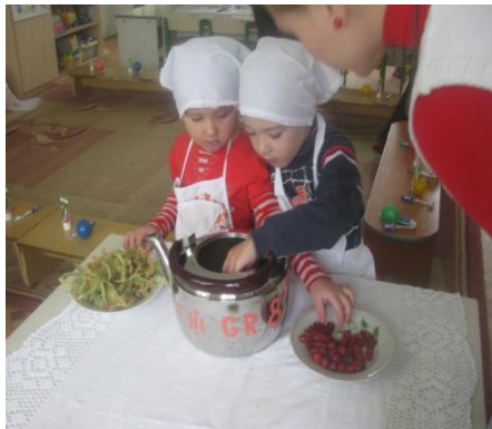
Lucrul la Centrul Menaj. Oare cum se face ceaiul gustos?