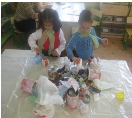
Lucrul la Centrul Știință. Învățăm să reciclăm deșeurii.