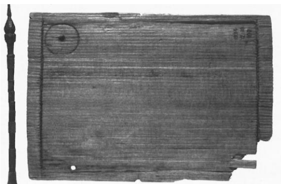
Figura 6 – Tăbliță cerată

În anul 2000 a fost descoperită o susținere minieră din lemn în rețeaua de galerii Țarina (zona Carnic), datată cu C14 și considerată ca fiind de la mijlocul sec. I î.Hr., o perioadă antemergătoare ocupației romane, deci cu galerii și tehnică minieră dacică. Din analizele și observațiile făcute asupra fazelor de săpare și din topografia rețelelor de galerii nu s-au putut distinge schimbări importante în tehnica minieră în perioada ocupației romane. După toate indiciile găsite, singura inovație adusă în minerit de romani a fost introducerea iluminării cu opaițe pentru care s-au practicat în pereții galeriilor nișe speciale. Încă o dată putem constata că aportul de civilizație adus Daciei de Imperiul Roman este discutabil. Scrisul pe tăblițele cerate ca element de civilizație a fost folosit doar pentru monitorizarea exploatării intense a bogățiilor Daciei. Se dovedește astfel din nou în istorie că civilizația discutabilă adusă de orice invadator este plătită foarte scump. Tăblițe cerate similare s-au găsit la Vindolanda ca și la Roșia Montana, din ele rămânând doar baza de lemn, fără ceara care nu a rezistat timpului. Așadar armata romană folosea ambele tipuri de scrieri, pe tăblițe cerate și necerate.