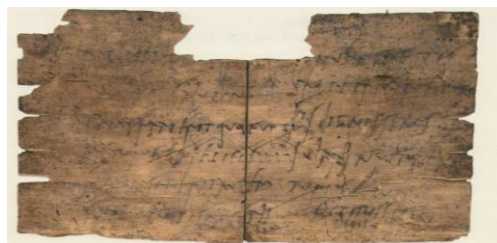
Figura 1 – Tăbliță găsită în Anglia

Tăblițele sunt de circa 3 mm grosime și cu dimensiuni de 9x20 cm (aproximativ dimensiunea unei cărți poștale). Scrisorile sunt scrise cu cerneală (au fost găsite și călimări și instrumente de scris). Scrisorile mai lungi sunt formate din mai multe tăblițe legate între ele iar adresa este scrisă pe exterior. Cele mai multe scrisori sunt ale unor soldați din Cohorta de Gali (Cohort Gallorum), Cohorta de Tungrini, Cohorta de Batavi (din zona Olandei) și cavaleria spaniolă.