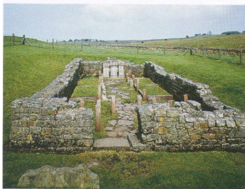
Figura 2 – Ruinele fortului roman

inflamații le ochilor. În final rezultau 265 de militari (cu un centurion) care erau activi.