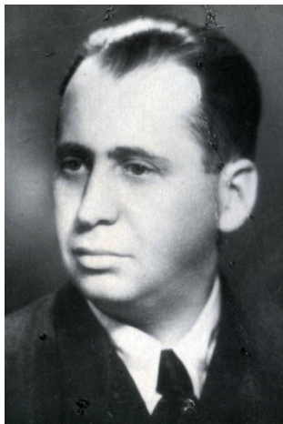
Fig. 1. Profesorul Alexandru Herlea, înainte de prima arestare, 1949.

International intitulat REGIMURILE COMUNISTE - MEMORIE RECENTĂ PENTRU O SOCIETATE DESCHISĂ a fost aleasă pentru o serie de considerente.